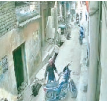
मोटरसाइकिल लेकर भागता चोर