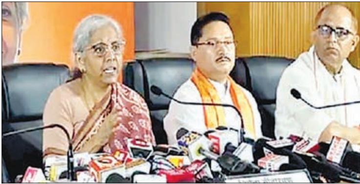
जरूरत है। साथ ही कहा कि लालू-राबड़ी के शासनकाल में जंगलराज के कारण बिहार में प्रति व्यक्ति आय 14,209 रुपये हो गई थी, जो फिलहाल 37,000 रुपये है। सीतारमण ने कहा कि जंगलराज मिटने के बाद पांच प्रतिशत का ग्रोथ मेटेन करने के

पटना। केंद्रीय वित्त मंत्री निर्मला सीतारमण ने कहा कि लालू-राबड़ी के जंगलराज में प्रति व्यक्ति आय 33 प्रतिशत गिर गई थी। जंगलराज के नुकसान से बाहर लाने के लिए कितनी मेहनत करनी पड़ी है, यह पहली बार बिहार की जनता को बताना जरूरी है। सम्मान चाहिए, विकास नहीं की बात बोलने वालों के समय में सकल घरेलू उत्पाद ऑडिशा से कम था। केंद्रीय वित्त मंत्री मंगलवार को पटना के भाजपा कार्यालय में पत्रकारों को संबोधित कर रही थी। उन्होंने कहा कि बिहार में फर्स्ट टाइम वोटर को यहां के जंगलराज से हुए नुकसान को बताने की