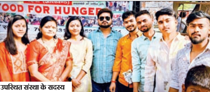
उपरिष्ठत संस्था के सदस्य