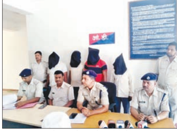
प्रेस कॉन्फ्रेंस करते एसडीपीओ