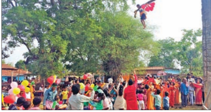
झुलन में भोक्ता से आधीष की फूल मांगते लोग।