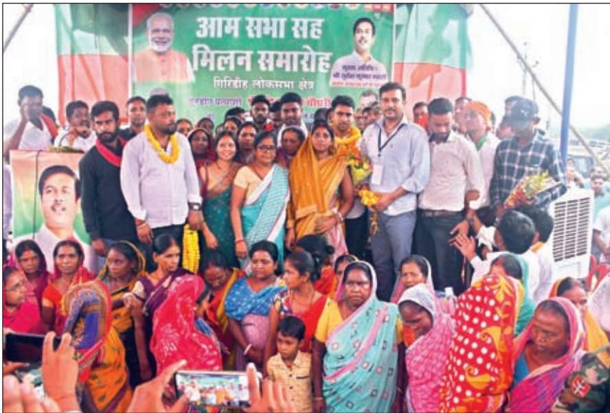
को जनता के सामने लगातार उजागर कर रही है। उन्होंने कहा कि संविधान की दुहाई देकर और

विकास नहीं तुष्टिकरण ही इनकी राजनीति का आधार है। इंडी, सीबीआई जैसी एजेंसियां जब अपना काम कर के इनके भ्रष्टाचार