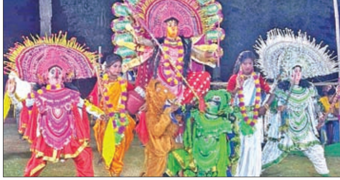
उनृत्य प्रस्तुत करती बंगाल की युवतियां।