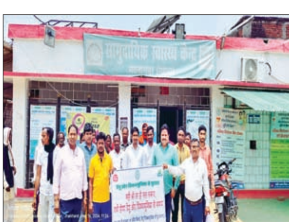
रैली में स्वास्थ्य कर्मी