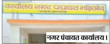
नगर पंचायत कार्यालय।

मझिआंव। नगर पंचायत कार्यालय से महज लगभग 200 मीटर की दूरी पर स्थित नगर पंचायत क्षेत्र के वार्ड नंबर चार स्थित हरिजन टोला के लोग आज भी मूलभूत सुविधाओं से वंचित हैं। नगर पंचायत बनने के 13 साल बीत जाने के बावजूद भी नगर पंचायत कार्यालय एवं बिजली विभाग के पदाधिकारी एवं जनप्रतिनिधियों के उदासीन रवैया के कारण यहाँ के लोग बिजली, नाली, गली एवं पीसीसी जैसे मूलभूत सुविधाओं से बिल्कुल वंचित हैं। इसके बावजूद भी नगर पंचायत कार्यालय के पदाधिकारी के द्वारा हिटलर शाही अंदाज में होलिंग टैक्स जमा करने के लिए दबाव बनाया जाता है। और लोग मजबूर होकर होलिंग टैक्स जमा भी करते हैं। इस