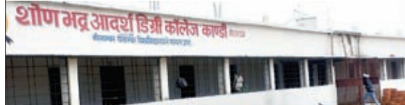
शोणभद्र आदर्श डिग्री कॉलेज