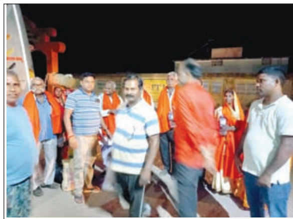
तीर्थयात्रियों को अंग वस्त्र देते मुखिया