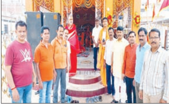
बैठक में शामिल लोग