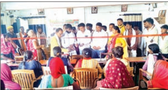
उद्घाटन करते अतिथि