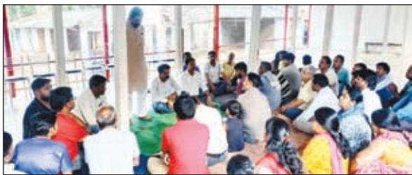
बैठक करते भाजपा कार्यकर्ता