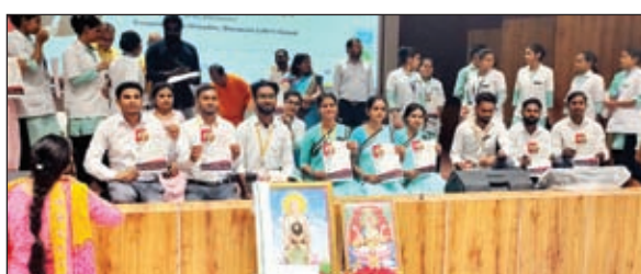
स्कॉलरशिप के साथ छात्र-छात्राएं