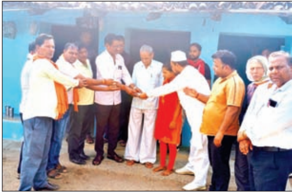
आर्थिक सहयोग करते शिक्षक

मृत सहायक अध्यापक के आश्रित को आर्थिक सहयोग