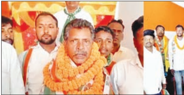
शामिल होते कार्यकर्ता