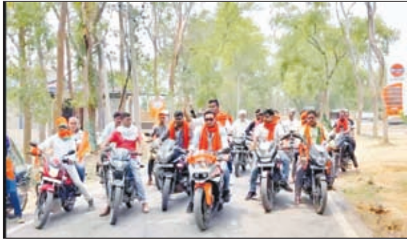
जनसंपर्क अभियान चलाते कार्यकर्ता