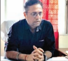
जानकारी देते बीडीओ

चंदवा। लोकसभा चुनाव को शांति व सौहार्दपूर्ण वातावरण में संपन्न कराने को लेकर जिला प्रशासन ने पूरी तरह से कम्प कस ली है। मतदान कर्मियों व पुलिस कर्मियों की सुरक्षा की दृष्टि से उग्रवाद प्रभावित सुदूरवर्ती ग्रामीण इलाकों के 8 बूथों को रीलोकेट (स्थानांतरण कर दिया गया है। रीलोकेट किए गए बूथों में