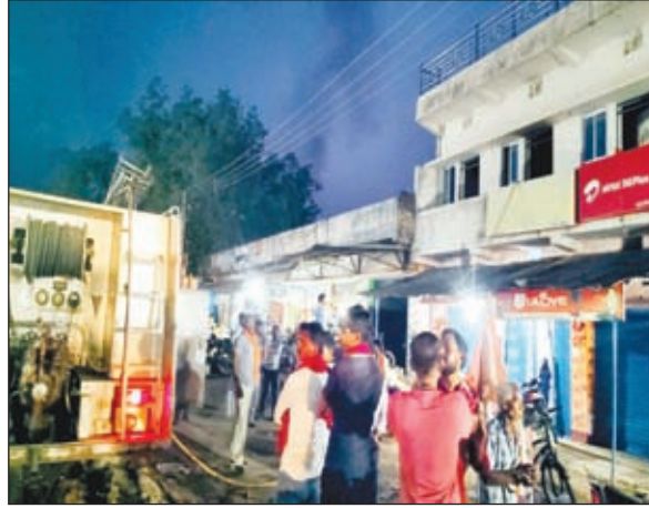
आग बुझाते लोग