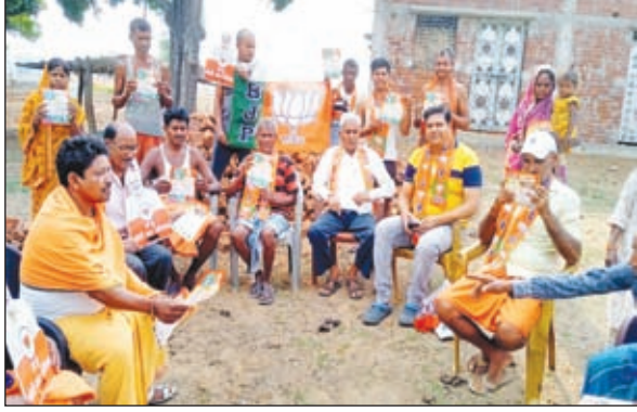
जनसंपर्क अभियान चलाते कार्यकर्ता