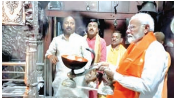
नामांकन से पूर्व काल शैरव की पूजा करते प्रधानमंत्री नरेंद्र मोदी।

वाराणसी। भाजपा के वरिष्ठ नेता एवं प्रधानमंत्री नरेन्द्र मोदी ने वाराणसी लोकसभा सीट से पार्टी के उम्मीदवार के रूप में मंगलवार को नामांकन पत्र दाखिल किया। इसके बाद रूद्राक्ष कन्वेशन सेंटर में पार्टी कार्यकर्ताओं के सम्मेलन में उनको बूथ जीतने का मंत्र दिया। उन्होंने कहा कि पार्टी संगठन की मजबूत इकाई हमारे पन्ना प्रमुख एवं बूथ समिति के सदस्य हैं। आप लोग अपनी जिम्मेदारी के तहत सरकार को योजनाओं को जन-जन तक पहुंचाने में योगदान दें। अधिक से अधिक लोगों को मतदान के लिए जागरूक करें। मोदी ने कार्यकर्ताओं को एक जुन तक अपना उत्साह और ऊर्जा बनाए रखने के साथ-साथ प्रत्येक