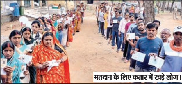
मतदान के लिए कतार में खड़े लोग ।