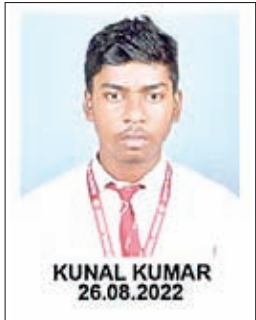
स्कूल, ओरमांडी के विद्यार्थियों ने इस वर्ष के सीबीएसई 10वीं और