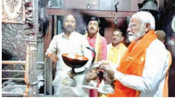
नामांकन से पूर्व काल शैव की पूजा करते प्रधानमंत्री नरेंद्र मोदी।

वाराणसी। भाजपा के वरिष्ठ नेता एवं प्रधानमंत्री नरेन्द्र मोदी ने वाराणसी लोकसभा सीट से पार्टी के उम्मीदवार के रूप में मंगलवार को नामांकन पत्र दाखिल किया। इसके बाद रूद्राक्ष कन्वेशन सेंटर में पार्टी कार्यकर्ताओं के सम्मेलन में उनको बूथ जीतने का मंत्र दिया। उन्होंने कहा कि पार्टी संगठन की मजबूत इकाई हमारे पन्ना प्रमुख एवं बूथ समिति के सदस्य हैं। आप लोग अपनी जिम्मेदारी के तहत सरकार को योजनाओं को जन-जन तक पहुंचाने में योगदान दें। अधिक से अधिक लोगों को मतदान के लिए जागरूक करें। मोदी ने कार्यकर्ताओं को एक जुन तक अपना उत्साह और ऊर्जा बनाए रखने के साथ-साथ प्रत्येक