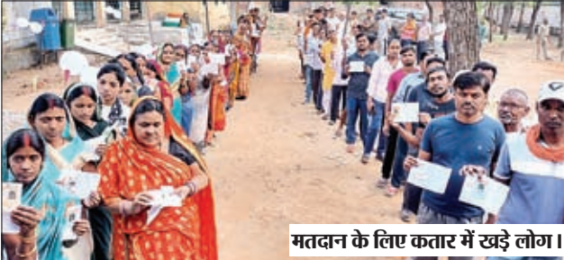
मतदान के लिए कतार में खड़े लोग।