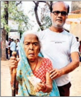
वोट देने पहुंची वृद्धा

मझिआंव। मझिआंव एवं बरडीहा प्रखंड क्षेत्र में संपन्न लोकसभा चुनाव में जहां एक ओर मतदाता इस चिल चिल्लाती धूप में लाइन में लग कर अपनी बारी का इंतजार करते रहे। वहीं बुजुर्ग महिला, पुरुष एवं विकलांग भी पीछे नहीं रहे। सभी ने खुलकर अपने मत का प्रयोग किया। लोकसभा चुनाव के दौरान ज्यादातर मतदान केंद्रों पर मतदाता उत्साहित दिखे। इस चिलचिलाती धूप में भी मतदाता कतारबद्ध होकर अपनी