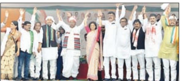
हुंकार भरते इंडिया गठबंधन के कार्यकर्ता, राष्ट्रीय अध्यक्ष को स्वागत करते जिला अध्यक्ष