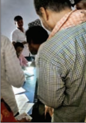
मोबाइल की रौशनी में मतदान कराते मतदान कर्मियों

गढ़वा। जिला मुख्यालय के सोनपुरवा स्थित शालीग्राम मध्य विद्यालय में चार बूथ स्थापित किये गये थे। बूथ सं 141 की वोटिंग सात बजे शुरू नहीं हो सकी। मशीनों में गड़बड़ी के कारण लगभग एक घंटा विलंब से वहां वोट शुरू किया गया। यहां बूथ पर मतदाताओं की काफी भीड़ लगी रही, लेकिन वोटिंग धीमी गति से ही होती रही। इसी बूथ पर शाम चार बजे मतदान कर्मियों को अपनी मोबाइल की रौशनी में मतदान कराते देखा गया। शाम साढ़े बजे तक इस बूथ पर 100 से ज्यादा मतदाता वोट करने के लिए कतार में खड़े थे। यही हाल बूथ सं 143