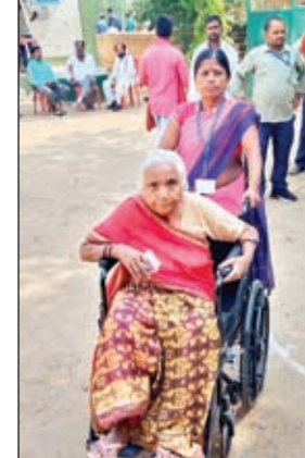
व्हील चेयर पर मतदान करने जाती वृद्धा

गढ़वा। लोकतंत्र का महापर्व तब और जीवंत हो गया जब 90 पर के बुजुर्ग अपनी कांपती होठों एवं शरथराती बदन की परवाह किये बिना व्हील चेयर पर बैठकर मतदान केंद्र पर पहुंच गये। यह यथांश केवल एक-दो बुजुर्ग का नहीं था। बल्कि 100 से ज्यादा बुजुर्गों पर अपने अतुल साहस का परिचय देते हुए अपनी एक वोट की ताकत को ईवीएम में दर्ज कराया। ऐसे मतदाताओं का बूथ पर स्वागत किया गया। उसे आशीर्वाद दिया गया एवं उन्हें वोट देने के लिए सुविधा प्रदान किया गया।