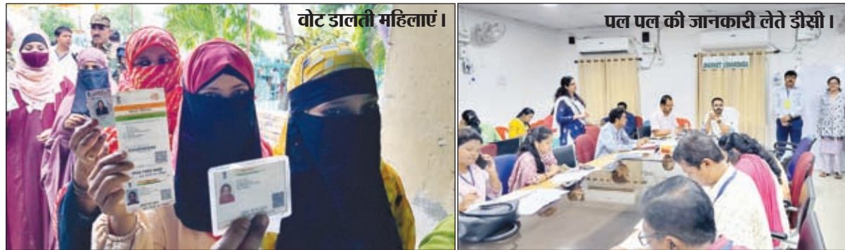
वोट डालती महिलाएं। पल पल की जानकारी लेते डीसी।