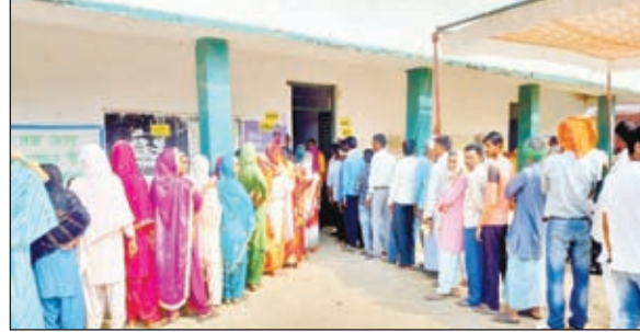
वोट देने के लिए कतार में खड़े मतदाता