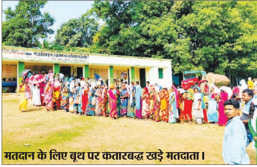
मतदान के लिए बूथ पर कतारबद्ध खड़े मतदाता।

मजबूत लोकतंत्र व बेहतर भविष्य की परिकल्पना को लेकर पहली बार युवतियों ने किया मतदान