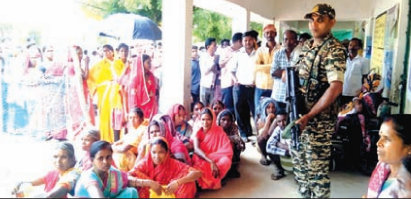
दिन खोलकर मतदाताओं ने किया मतदान, बायलेट पर बुलेट भारी होने की कहावत हो गयी पुरानी।

गुमला। नक्सलियों के गढ़ कहे जाने वाले चनालात, जमटी व कुम्हारी गांव में लोकतंत्र का विजय यताका लहराता नजर आया। इन क्षेत्रों के बूथों में मतदाता एकजुट होकर मतदान किये और बेहतर लोकतंत्र गढ़ने का संकल्प लिया। वनालात स्कूल के दो बूथ पर काफी संख्या में मतदाता वोट देने पहुंचे थे। पूरा स्कूल परिसर मतदाताओं से खचाखच भरा हुआ था। ये वे क्षेत्र हैं जहां कभी नक्सलियों की तुली बोलती थी। नक्सलियों का एक फरमान क्षेत्र के ग्रामीणों के अंदर दहशत पैदा कर देता और वे लोकतंत्र के महापर्व में भाग लेने से कोसों दूर हो जाते थे। लेकिन परिस्थितियों बदली, क्षेत्र का कायाकल्प हुआ, विकास की परिकल्पना धरातल पर साकार हुई, लोगों की सोच बदली और लोकतंत्र के महापर्व में उनका यह संकल्प वोट के रूप में तब्दील होते स्पष्ट नजर आया। उग्रवाद प्रभावित इन गांवों में सरकार ने एक्शन प्लान तैयार किया और क्षेत्र के विकास के लिए पुल-पुलिया, सड़क व पेयजल की समस्या का समाधान किया। जिससे क्षेत्र की सूरत तो बदली ही लोगों की सोच भी बदल गई। यही कारण है के क्षेत्र के विकास को लेकर इन उग्रवाद प्रभावित क्षेत्र के बूथों पर जमकर मतदान हुआ। ये ऐसे क्षेत्र हैं जहां कम सुरक्षाबलों की प्रतिनियुक्ति कर शांतिपूर्ण मतदान कराया जा रहा है। एक समय ऐसा था कि इन क्षेत्रों में सुरक्षा बलों