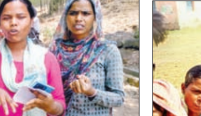
खबर मंत्र संवाददाता

कैरो। लोकसभा चुनाव को लेकर प्रखंड क्षेत्र में मतदाताओं में गजब का उत्साह व जन्मा नजर आया। अहले सुबह पांच बजे ही खरता बूथ संख्या 177 में पोलिंग पार्टी तैयारी कर ही रही थी और इधर मतदाताओं की कतार देखर पोलिंग पार्टी में भी उत्साह दिखाई दिया। वहीं पूरे प्रखंड क्षेत्र में मतदान को लेकर सभी बूथों में भीड़भाड़ दिखनी। कुछ मतदान केन्द्र में पांच बजे के करीब तक चला। बूथ संख्या 177 खरता में अपनी जीवन