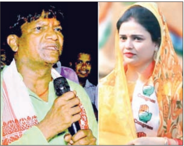
खबर मन्त्र संवाददाता

दोनों उम्मीदवार पूरे क्षेत्र में धुआंधार चुनाव प्रचार कर लोगों से अपने अपने पक्ष में मतदान करने की अपील कर रहे हैं