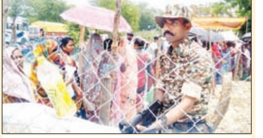
सुरक्षा के साथ में हुआ मतदान।

थी। वहीं पूर्वाह्न 11 बजे तक कुल 27.77% मतदान हुए। जिसमें सिसई विधान सभा में 25.74%, गुमला विधान सभा में 28.01% एवं विशुनपुर विधान सभा में 29.33% तक मतदान हुआ। पूर्वाह्न 01 बजे तक कुल 43.4% मतदान हुआ। जिसमें सिसई विधान सभा में 44.16%, गुमला विधान सभा में 44.02% एवं विशुनपुर विधान सभा में 44% मतदान हुआ था। जबकि 03 बजे तक कुल 56.72% मतदान हुआ। जिसमें सिसई विधान सभा में 57.87%, गुमला विधान सभा में 57.10% एवं विशुनपुर विधान सभा में 56.2% मतदान हुआ था। वहीं शाम पांच बजे तक लोहरदगा संसदीय क्षेत्र के गुमला जिला में कुल 62.06% मतदान हुआ। जिसमें शाम पांच बजे तक सिसई विधान सभा में 62.07%, गुमला विधान सभा में 62.03% एवं विशुनपुर विधान सभा में 60.71% प्रतिशत मतदान हुआ। इस दौरान सुबह में गई बूथों पर वीवीपेट मशीन खराब होने के कारण कुछ देर से मतदान