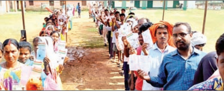
खबर मंत्र संवाददाता

भंडरा। लोकसभा चुनाव के चौथे चरण में सोमवार को लोहरदगा लोकसभा सीट में भंडरा प्रखंड के विशुनपुर विधान सभा क्षेत्र के 24 मतदान केन्द्र और लोहरदगा विधान सभा क्षेत्र के 30 केन्द्र कुल 54 बूथों पर मतदान प्रक्रिया सुबह 07 बजे शुरू हो गई है। शाम 05 बजे तक मतदान हुआ है। मतदान के दो घंटे में 9 बजे तक 11.8 प्रतिशत मतदान हुआ। सुबह 11 बजे तक यानी