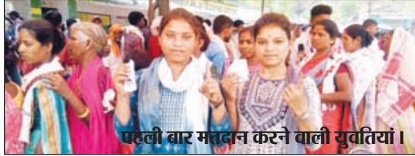
पहली बार मतदान करने वाली युवतियां।

मजबूत लोकतंत्र व बेहतर भविष्य की परिकल्पना को लेकर पहली बार युवतियों ने किया मतदान