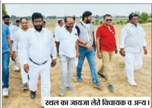
स्थल का जायजा लेते विधायक व अन्य।