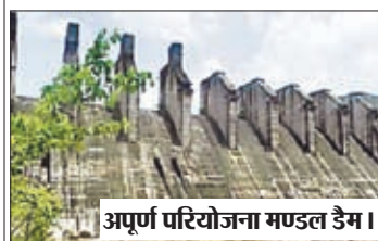
अपूर्ण परियोजना मण्डल डैम।