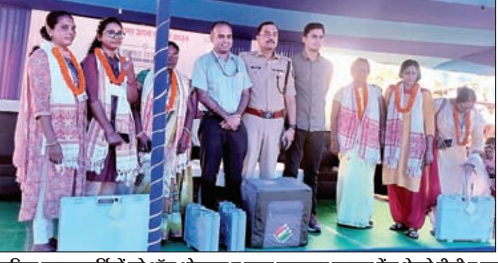
महिला मतदान कर्मियों को शॉल ओढ़ाकर व माला पहनाकर मतदान केंद्र भेजते डीसी व एसपी। डिस्पैच सेंटर में सामग्री लेने के लिए लगी मतदान कर्मियों की भीड़।

● लोहरदगा संसदीय क्षेत्र में हैं 14 लाख 41 हजार 302 मतदाता ● डीसी-एसपी डिस्पैच सेंटर में रहे उपस्थित ● 950 बूथों के लिए मतदान कर्मियों को किया गया रवाना