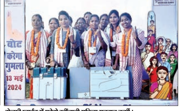
महिला मतदान कर्मी को डीसी व एसपी ने किया रवाना

बूथों पर जाने वाले मतदान कर्मियों के चेहरे में दिखा गजब का उत्साह, लोकतंत्र के महापर्व को निष्पक्षता के साथ पूरा करने में अहम योगदान देंगे मतदानकर्मी