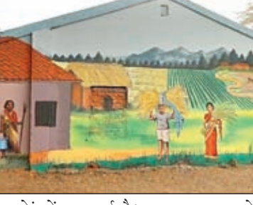
वोटर जब मतदान केंद्र में 13 में की सुबह 7:00 बजे पहुंचेंगे तो सबसे पहले उनका जोहर से स्वागत किया जाएगा। वोटर के स्वागत के लिए कई व्यवस्थाएं उपलब्ध कराई गई हैं। जब मतदाता अपने मतदान केंद्र में पहुंचेंगे तो उन्हें मतदान केंद्र का स्वरूप कुछ बदला बदला सा दिखाई देगा। क्योंकि इन मतदान केंद्रों में झारखंड आदिवासी संस्कृति डोकरा कला और

रोशन कुमार लोहरदगा। 13 में को लोहरदगा में होने वाले मतदान को लेकर मतदान केंद्र को अलग-अलग स्वरूप में दिखाने का काम किया गया है। लोहरदगा सदर क्षेत्र भंडरा इलाकों में मतदान केंद्रों की दीवारों पर पेंट कर अलग-अलग स्वरूप देने का काम किया गया है। कहीं डोकरा तो कहीं आदिवासी संस्कृति तो कहीं लोहरदगा के ऐतिहासिक स्थलों को दर्शाया गया है।