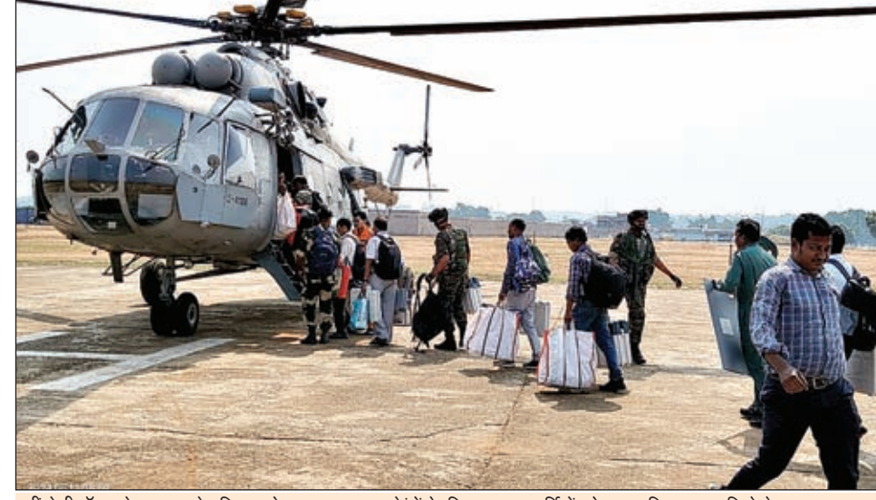
वहीं हेलीकॉप्टर के माध्यम से रिविवा को कुल 13 मतदान केंद्रों के लिए मतदान कर्मियों को रवाना किया गया। जिले के दूरस्थ व उग्रवाद प्रभावित क्षेत्रों में स्थापित बूथों तक मतदान कर्मियों को सुरक्षित मतदान केंद्र तक हेलीकॉप्टर के माध्यम से पहुंचाया गया। हेलीकॉप्टर में कई मतदान कर्मी पहली बार बैठे थे। जिसे उनमें काफी उत्साह का सवार हो रहा था। 13 बूथों पर मतदान कर्मियों को ले जाने के लिए कई बार हेलीकॉप्टर को रवाना किया गया। हेलीकॉप्टर से जाने वाले मतदान कर्मियों ने कहा कि वे निष्पक्ष मतदान कराने के लिए प्रतिबद्ध हैं और निर्धारित समय तक वे बूथों पर मतदान कराएंगे।

सभी मतदान कर्मियों के चेहरे पर खुशी थी। क्योंकि अब जिले में उग्रवादियों की चहल कदमी पर विराम लग गया है। पहले उग्रवादी संगठनों के कारण दूर के बूथों पर जाने वाले मतदान कर्मियों के चेहरे पर मासूसी छा जाती थी। लेकिन यह पहला मौका है जब जिले में कहीं से भी उग्रवादियों के वोट बहिष्कार की बात सामने नहीं आयी है। यही कारण है कि मतदान कर्मी अपने प्रतिनियुक्त बूथों पर खिलखिलाला चेहरा लेकर रवाना हुए। बूथ पहुंचकर मतदान कर्मी अपनी तैयारी में जुट जाएंगे। सोमवार को सुबह सात बजे से शाम पांच बजे तक मतदान होगा।