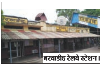
बरवाडीह रेलवे स्टेशन।

सुनील सिंह ने भी प्रचंड वोटों से जीत हासिल की थी। वहीं 5 जनवरी 2019 को सांसद सुनील सिंह ने देश के प्रधानमंत्री के हाथों अधूरे पड़े मण्डल डैम का शिलान्यास कराया था और 2022 तक इस योजना को पूर्ण करके उद्घाटन करने का वादा जनता के समक्ष किया गया था। लेकिन आज 2024 चुनाव में भी यह मुद्दे ज्वलंत है। मण्डल डैम के निर्माण के नाम पर अब तक एक ईंट रखने का काम भी नहीं किया गया है। वहीं दूसरी ओर भाजपा के वर्तमान प्रत्याशी इन मुद्दों पर अब तक कोई बात नहीं कर रहें है। चुनावी भाषणों से भी यह मुद्दे विलुप्त हो गए हैं।