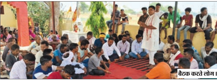
बैठक करते लोग।