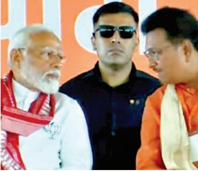
आशिर्वाद और समर्थन से ही देश में तीसरी बार मोदी सरकार बनेगी।