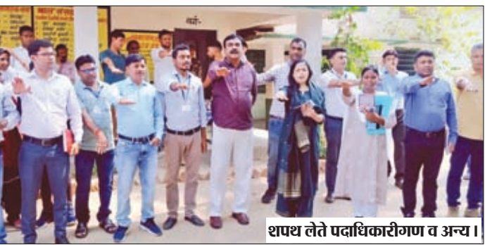
शपथ लेते पदाधिकारीगण व अन्य।