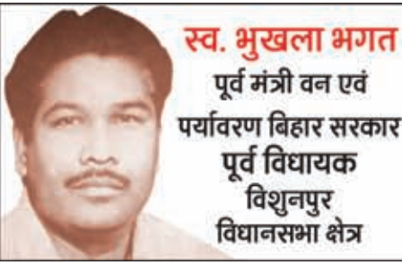
स्व. भुखला भगत पूर्व मंत्री वन एवं पर्यावरण बिहार सरकार पूर्व विधायक विशुनपुर विधानसभा क्षेत्र