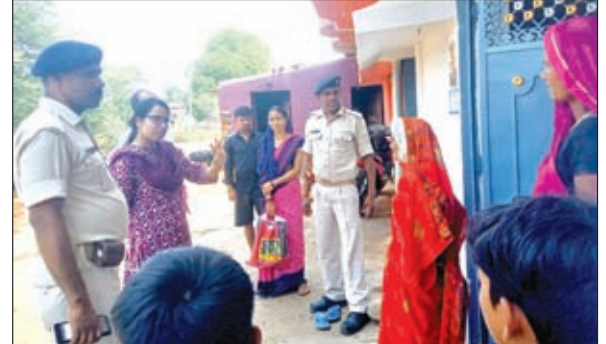
खबर मन्त्र संवाददाता

कोडरमा। लोकसभा आम निर्वाचन के निमित्त 5 कोडरमा लोकसभा क्षेत्र अंतर्गत स्वच्छ निष्पक्ष और शांतिपूर्ण तरीके से संपन्न कराने में मतदाता जागरूकता से संबंधित कई कार्य किये जा रहे हैं। वहीं शत-प्रतिशत मतदान कराने को लेकर बृथ लेवल अधिकारी द्वारा घर-घर जाकर मतदाताओं के बीच वोटर इंफोर्मेशन रिलप का वितरण किया जा रहा है और मतदाताओं को 20