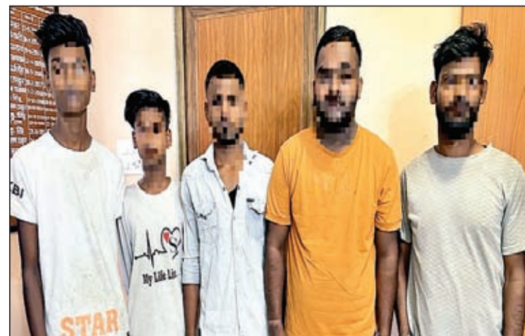
गिरफ्तार अभियुक्तों में :

छापामारी कर उसे गिरफ्तार किया गया। वहीं उसके निशानदेह पर तिलैया एवं अन्य थाना के मोटरसाइकिल चोरी से संबंधित कई कांडों का उद्बेदन हो पाया है। छापेमारी के दौरान डोमचांच जंगल एवं गझंडी जंगल से चोरी के पांच मोटरसाइकिल बरामद किया गया एवं मोटरसाइकिल चोरी के विभिन्न कांडों के चार अन्य अभियुक्तों को भी गिरफ्तार किया गया है। इस संबंध में विधि-सम्मत कार्रवाई की जा रही है।