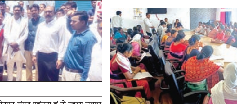
बैठक में मौजूद अधिकारी