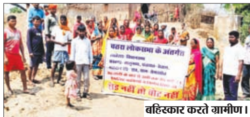
बहिष्कार करते ग्रामीण।