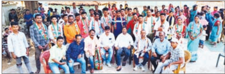
भाजपा को कांग्रेस में शामिल हुए कार्यकर्ताओं के साथ कांग्रेसी