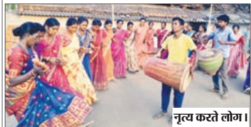
नृत्य करते लोग।

बारियातू। प्रखंड के साल्वे पंचायत अंतर्गत साल्वे अलखडिहा व, गुरुसालवे मे सरहुल का त्यौहार हर्षोल्लास के साथ मनाया गया। पारंपरिक रूप से सभी गांव में बारी-बारी से सरहुल का त्यौहार मनाया जाता है। इसी क्रम में आज साल्वे ग्राम के सभी टोले मे प्रकृति का महापर्व सरहुल मनाया गया। गांव के पहलन पुरोहित ने मां सरना की पुजा कर ग्रामवासीयों की सुख समृद्धि और खुशहाली की कामना की। इस अवसर पर आदिवासी समुदाय के महिला पुरुष युवक युवतियों ने अपनी पारंपरिक नृत्य कला संस्कृति का मनमोहक प्रस्तुति देकर सभी का मन मोह लिया। सरहुल त्यौहार के माध्यम से आदिवासी समुदाय प्रकृति प्रेम व पर्यावरण संरक्षण का संदेश देते है।