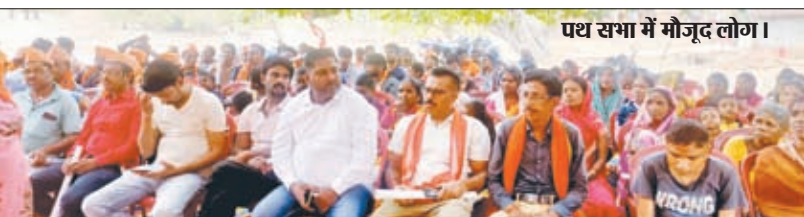
पथ सभा में मौजूद लोग।