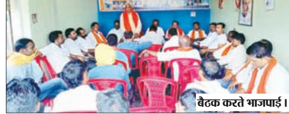
बैठक करते भाजपाई।