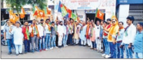
मौके पर उपस्थित अतिथियों के साथ भाजपाई व आजसू पदाधिकारी