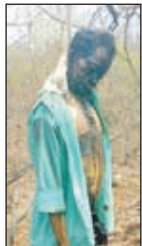
मृतक व्यक्ति का शव।