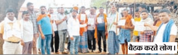
बैठक करते लोग।