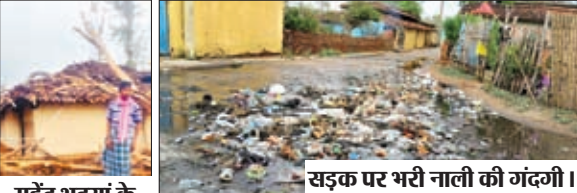
सड़क पर गरी नाली की गंदगी।