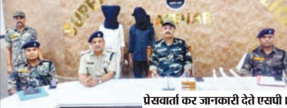
प्रेसवार्ता कर जानकारी देते एसपी।