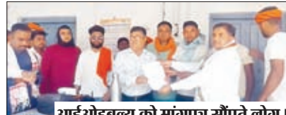
आईओडबल्यू को मांगपत्र सौंपते लोग।

→ दर्जनों गांव के लोगों के लिए रेलवे स्टेशन, मंदिर और बाजार आदि जाने का एकमात्र मुख्य मार्ग है