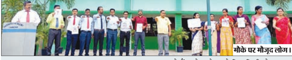
मौके पर मौजूद लोग।