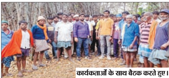
कार्यकर्ताओं के साथ बैठक करते हुए।