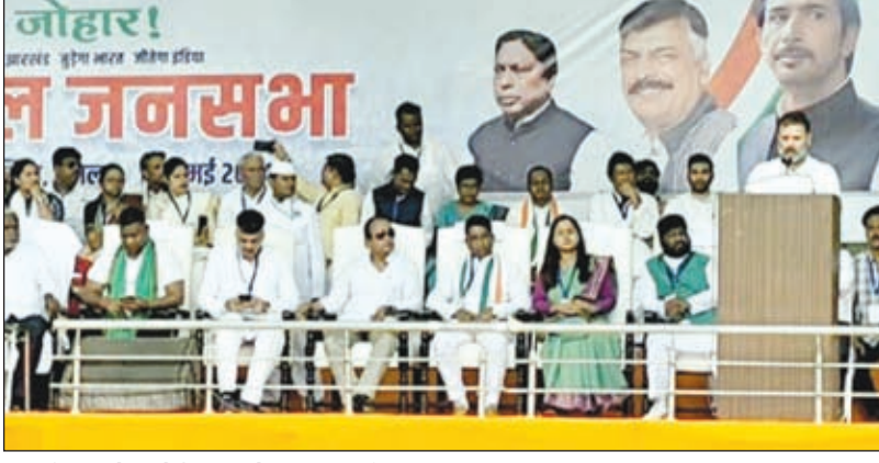
कार्यक्रम को संबोधित करते राहुल गांधी।

बसिया में कांग्रेसी प्रत्याशी के पक्ष में आयोजित विशाल चुनावी सभा संपन्न, भाजपा पर अपने भाषण के दौरान हमलावर रहे सीएम