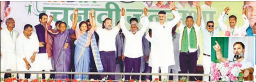
चाईबासा में जोबा माझी के पक्ष में एकजुटता दिखाते राहुल गांधी, कल्पना सोरेन व इंडिया गठबंधन के अन्य नेतागण और कार्यक्रम को संबोधित करते राहुल गांधी (इनसेट में)।