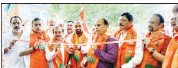
बिरसानगर में भाजपा के चुनावी कार्यालय का उद्घाटन करते भाजपा प्रत्याशी सह जमशेदपुर के सांसद विद्युतवरण महतो।

जमशेदपुर। जमशेदपुर लोकसभा चुनाव को लेकर सांसद सह भाजपा प्रत्याशी विद्युत बरण महतो का जनसंपर्क अभियान लगातार जारी है। मंगलवार को सांसद विद्युत महतो ने जमशेदपुर पुर्वी विधानसभा क्षेत्र के सीतारामडैरा मंडल अंतर्गत बाराहारी स्थित गांधी आश्रम देवनगर में जनसंपर्क