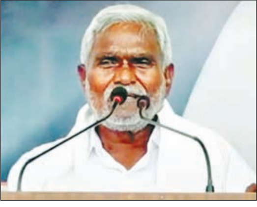
कार्यक्रम को संबोधित करते सीएम चंपई सोरेन।