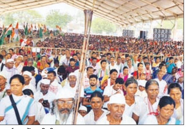
कार्यक्रम में उमडी भीड़।