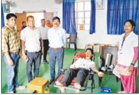
रक्तदान करते युवक व उपस्थित लोग।

स्वीप कोषांग के अंतर्गत रक्तदान शिविर का आयोजन किया गया