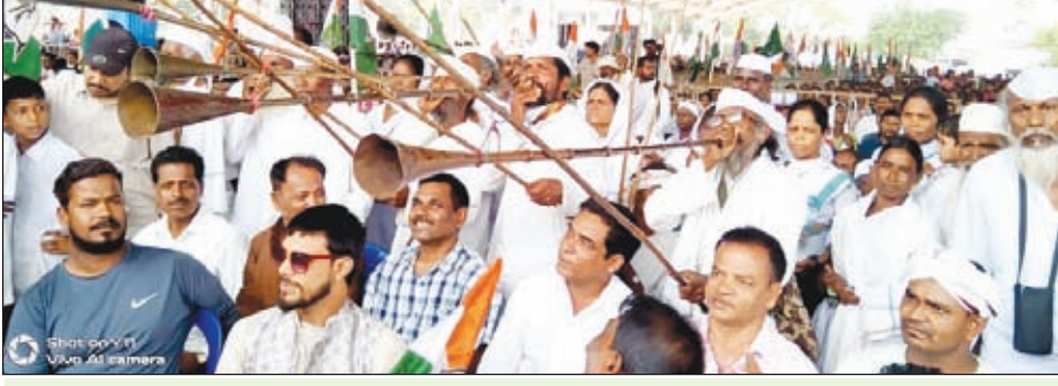
बसिया में आयोजित इंडिया गबंधन के चुनावी सभा में टाना भगत समाज के लोग पारंपरिक वाद्य यंत्र लेकर शामिल हुए। कोई भी नेता भाषण देते थे तो टाना भगत लोग यंत्र बजाकर उन्हें प्रोत्साहित करते नजर आये। लेकिन वे अधिक पारंपरिक वाद्य यंत्र बजाने लगे। जिसे मंच से उनको सही समय पर वाद्य यंत्र बजाने की सहाय दी गई।

हुए हैं। पिछड़ी जाति का आरक्षण पारित कर राज्य सरकार ने भेजा लेकिन राजभवन उसे लटकाये हुए है। झारखंड में जब हेमंत सोरेन के नेतृत्व में सरकार बनी थी तो हर वर्ग के लोगों को पेंशन दिया जा रहा है। पेंशन की राशि से बुढ़े मां-बाप को संकुन मिल रही है। वहीं भाजपा झारखंड को हमेशा लूटना चाहती है। खनिज संपदा से भरे झारखंड को भाजपा लूट का चारागाह बनाना चाहती है। इंडिया गठबंधन झारखंड को बचाने में जुटी है।