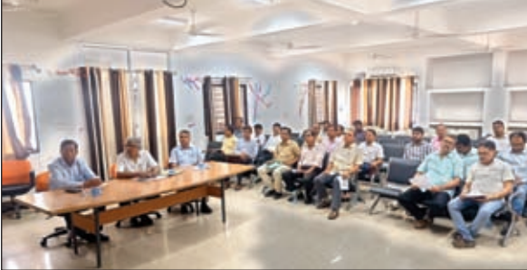
बैठक करते कुलपति एवं एकेडमिक काउंसिल सदस्य