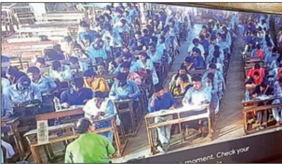
परीक्षा दे रहे बीएड छात्रों का सीसीटीवी फुटेज