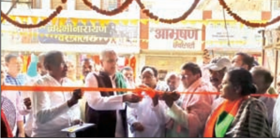
उद्घाटन करते अतिथि