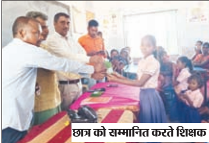
छात्र को सम्मानित करते शिक्षक।