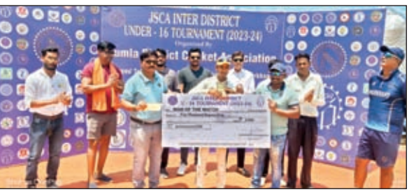
प्लेयर ऑफ द मैच को सम्मानित करते अतिथि