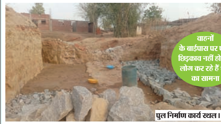
वाहनों के बाईपास पर पानी छिड़काव नहीं होने से लोग कर रहे हैं धूल का सामना