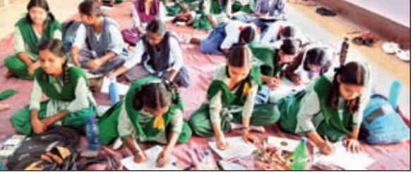
प्रतियोगिता में शामिल बच्चयों