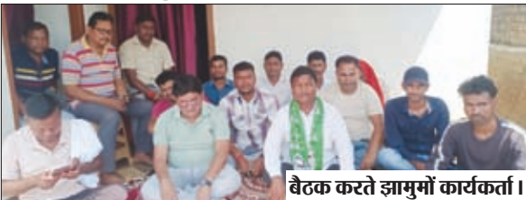
बैठक करते ज़ामुमो कार्यकर्ता।