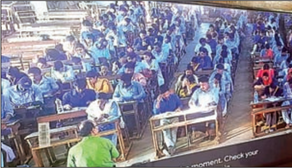
परीक्षा दे रहे बीएड छात्रों का सीसीटीवी फुटेज