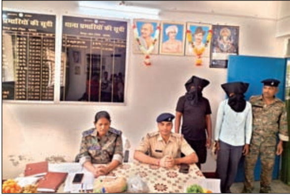
गिरफ्तार युवकों के साथ थाना प्रभारी व अन्य इलेक्ट्रॉनिक दूकान से 170 ग्राम गांजा बरामद किया। गांजा बेचने