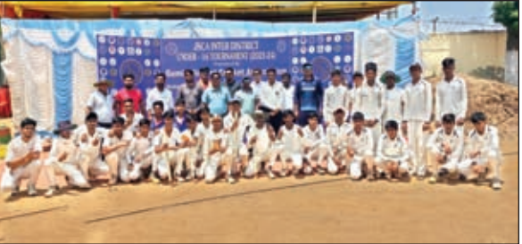
दोनों टीमों के साथ अतिथि