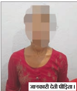
जानकारी देती पीड़िता।

सात बजे टोले के हॉट-तीन युवक कर युवकों ने पकड़ लिया व मारपीट करते हुए अपने घर के अंदर ले गया व मरे कपड़े फाड़कर छेड़खानी का प्रयास करने लगा व शरीर मे