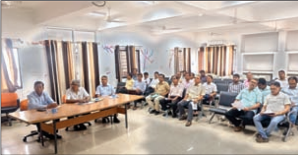
बैठक करते कुलपति एवं एकेडमिक काउंसिल सदस्य