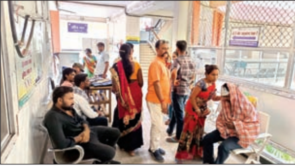
विलाप करते परिजन