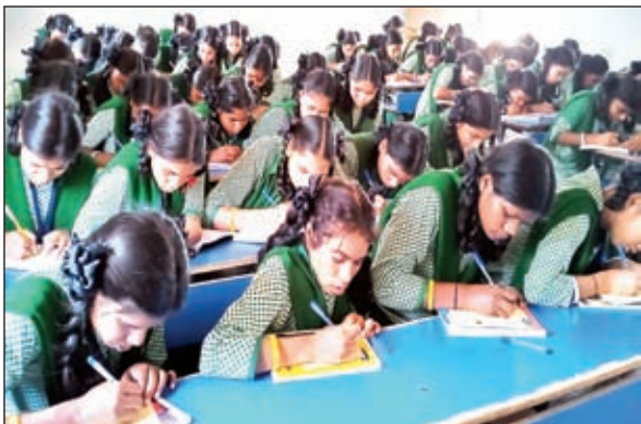
कार्यक्रम में शामिल छात्राएं

गुमला। जिले में 13 मई को होने वाले लोकसभा आम चुनाव 2024 के निमित्त मतदान के प्रतिशत को बढ़ाने के उद्देश्य से आम नागरिकों के बीच विभिन्न गतिविधियों का आयोजन करते हुए मतदाताओं को जागरूक करने का कार्य किया जा रहा है।