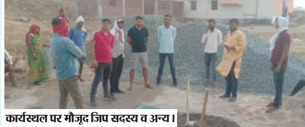
कार्यस्थल पर मौजूद जपि सदस्य व अन्य।

वहीं कार्यस्थल पर मौजूद मुंशी से जब पूछा गया कि यहां पर पुल निर्माण का कार्य कौन करवा रहा है तो मुंशी संवेदक का नाम बताने से हिचकीचाने लगे और संवेदक का नाम नहीं बताया, यहां तक की सरकार द्वारा तय की गई मजदूरों की मजदूरी भी मुंशी को पता नहीं था साथ ही कार्यस्थल पर कोई बोर्ड भी नहीं लगाया गया था।