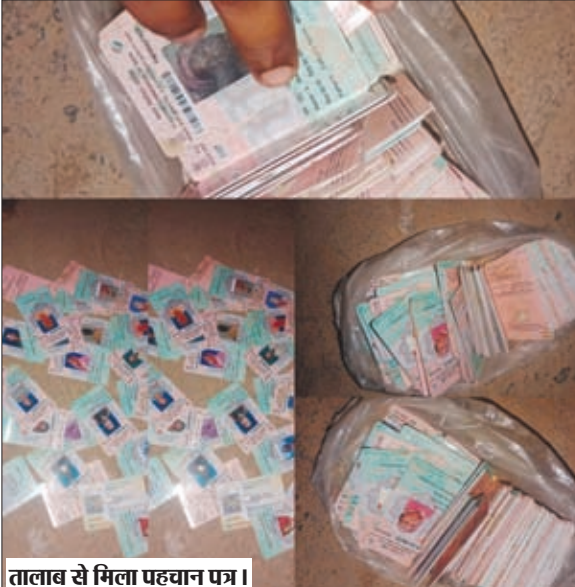
तालाब से मिला पहचान पत्र।