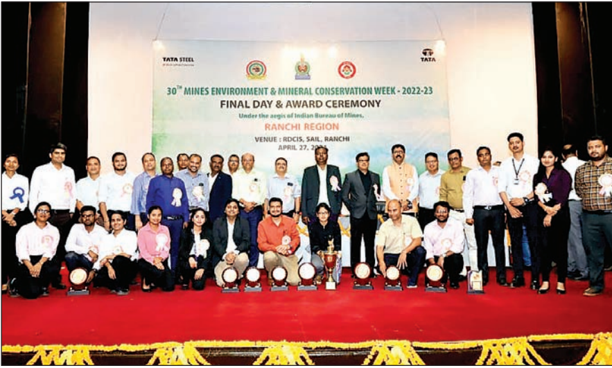
विजेता टाटा स्टील की टीम।

टाटा स्टील ने स्टॉल डिस्प्ले में प्रथम पुरस्कार जीता, जिसे खदानों और पर्यावरण के संरक्षण के प्रति