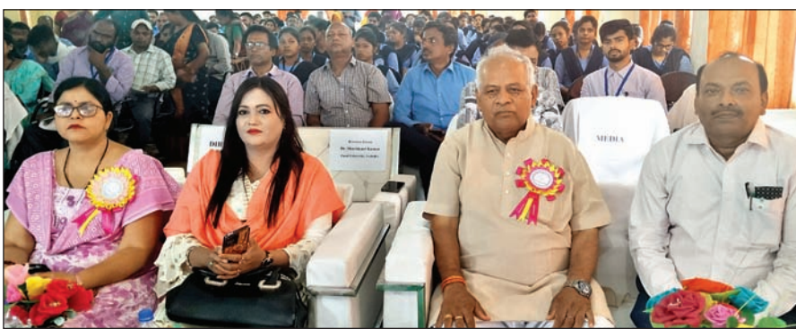
कार्यक्रम में उपस्थित अतिथि, निदेशक और सचिव।

ओरमांडी। प्रौद्योगिकी शिक्षा को अग्रगण्य में विशेषता व विप्रेत प्रभाव दोनों की जानकारी जरूरी है। आज पर्यावरणविद भी प्रकृति संरक्षण के प्रति चिंतित हैं। पेड़ पौधों की कटाई से जंगली हाथियों की बस्ती में प्रवेश कर रहे हैं। हाथियों का हमला भी बढ़ा है। डिजिटलाइजेशन से बेपरलेस