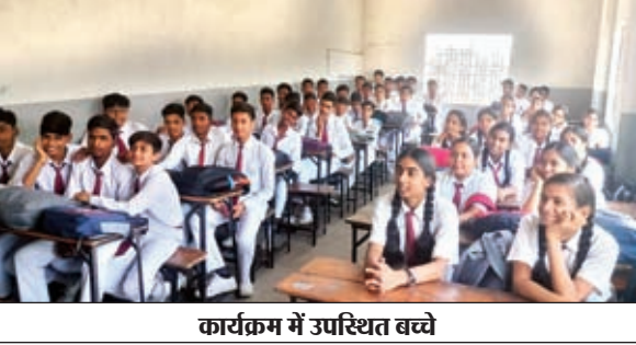
कार्यक्रम में उपस्थित बच्चे

केंद्र सरकार ने दी सलाह: प्रचंड गर्मी को देखते हुए केंद्रीय श्रम एवं रोजगार मंत्रालय ने झारखंड को भी जरूरी दिशा निर्देश भेजा है। उसी आधार पर उप प्रमुख्यत रांची को ओर से सभी जिलों को शनिवार को श्रमिकों के मामले में कुछ जरूरी बिंदुओं का ध्यान रखने को कहा गया है। केंद्र के निर्देश पर होगा श्रमिकों का लगातार हेल्थ चेक अप जरूरी है। जितने भी प्रतिष्ठान, बिल्डर, निर्माणकर्ता, नियोजक हैं, उनसे कहा गया है कि वे कामगारों के काम के घंटे या समय को पुनर्निर्धारित करें। कई स्थल पर भरपूर पानी की व्यवस्था हो, आराम करने को छायादार व्यवस्था, प्राथमिक चिकित्सा किट, ओआरएस वगैरह हो। दवा और आपातकाल के लिए एंबुलेंस की व्यवस्था हो। होट वेव (लू) से बचाव के लिए बाहरी प्रतिविधि के लिए विश्राम अवकाश की आवृत्ति और बढ़ायी जाये। लू से गंठित कामगार को नजदीकी स्वस्थकेंद्र में ले जाये। पंचवती महिलाओं और चिकित्सकीय स्थितिवाले श्रमिकों पर अतिरिक्त ध्यान दिया जाये। कर्मचारियों को लू की चेतावनी के बारे में सूचित करें।