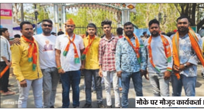
मौके पर मौजूद कार्यकर्ता।