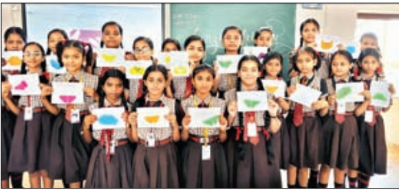
प्रतियोगिता में शामिल