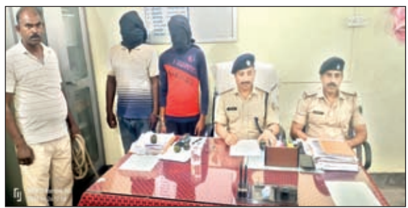
जानकारी देते अधिकारी

चौपारण। चोरदाहा चेकपोस्ट के पास वाहनों के सघन चेकिंग के दौरान अनुमंडल पुलिस पदाधिकारी बरही के निदेशानुसार अहले सुबह चौपारण की ओर से एक पिकअप वाहन बीआर03जीबी-9703 आता हुआ दिखाई दिया, जिसे जांच हेतु रूकने का इशारा करने पर वाहन चालक अपना वाहन को रोकने के बजाय और तेजी से चलाकर भागने का प्रयास करने लगा। परन्तु आगे बड़ी वाहन रहने के कारण भागने में सफल नहीं हो पाया, जिसके उपरांत वाहन से 02 व्यक्ति उतरकर भागने का प्रयास कर रहे थे। जिन्हें साथ के सशस्त्र बल के सहयोग से पकड़ लिया