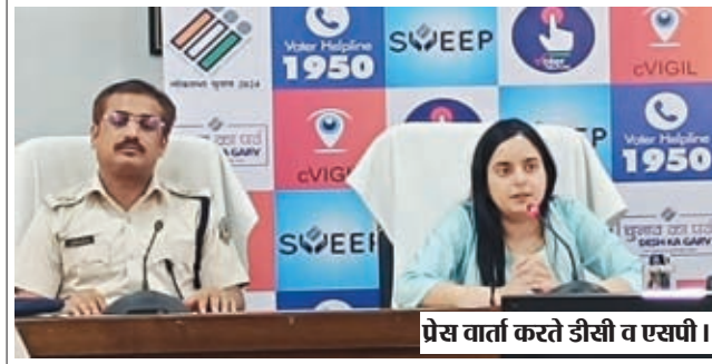
प्रेस वार्ता करते डीसी व एसपी।

विधान सभा क्षेत्र में कुल 565854 मतदाताओं की संख्या है। जिसमें 73 महिला विधान सभा अन्तर्गत 259652 एवं 74 लातेहार विधान सभा अन्तर्गत 306202 है। जिसमें