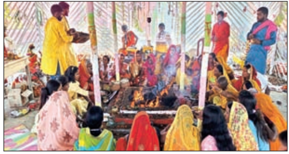
श्री श्री 1008 श्री शतचंडी महायज्ञ महाभण्डारा के साथ हुआ सम्पन्न