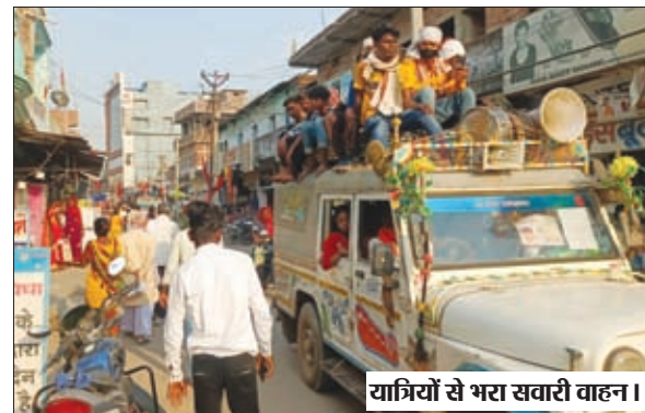
यात्रियों से भरा सवारी वाहन।

बरवाडीह। बरवाडीह प्रखण्ड के मंडल-मोरवाई बरवाडीह एवं लात-छिपादोहर-बरवाडीह के साथ चपरी - छेंचा- पुटुवागढ़ मुख्य मार्ग पर प्रतिदिन जान जोखिम में डालकर यात्रा करने से लोग नहीं हिचकिचा रहे हैं। चार पहिया सवारी वाहन चालकों को भी यात्रियों के जान की कोई परवाह नहीं है। इन मार्गों पर हर रोज यह स्थिति दिन भर देखी जा रही है। जहां यात्रियों को भरकर जीप, मैजिक व सवारी गाड़ियां खस्ताहाल सड़को पर फराटें भरती हुई दौड़ रही हैं। बरवाडीह से कुटमु- दुबियाखाड़ डालतनगंज एवं छिपादोहर मार्ग पर चल रहे ऑटो चालक भी मनमानी तरीके से सवारियां भर रहे हैं। जर्जर सड़को पर ओवरलोड वाहनों के परिचालन होने के बावजूद पुलिस प्रशासन भी मूकदर्शक बना हुआ है, तथा लोग