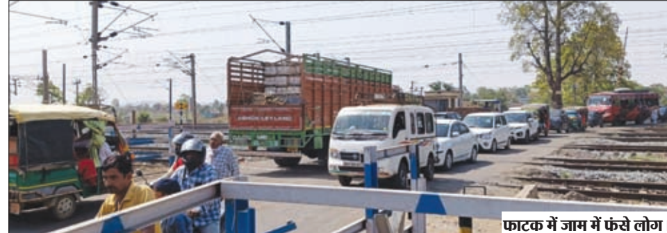
फाटक में जाम में फंसे लोग।

चंदवा। सीआईसी सेक्शन बरकाकाना-बरवाडीह रेलखंड अंतर्गत टोरी जंक्शन पूर्वी क्विन्थ स्थित रेलवे समपार फाटक पर शुक्रवार को भारी जाम से परेशान रहे। अहले सुबह लगभग 6 बजे, 9 बजे व दोपहर में भी कई बार रेलवे फाटक पर भारी जाम की समस्या से लोगों को दो-चार होना पड़ा। जाम के दौरान फाटक के दोनों छोर पर सैकड़ों की संख्या में छोटी-बड़ी व भारी वाहन फंसे रहे, रेलवे फाटक पर यातायात सुव्यवस्थित करने को लेकर कोई प्रबंध नहीं रहने के कारण वाहन चालक आपाधापी में वाहनों को जैसे जैसे खड़ी कर दिए थे। फाटक खुलने के बाद आपाधापी में पहले रेलवे फाटक पार करने के चक्कर में दोनों छोर के वाहन आमने-सामने हो गए व