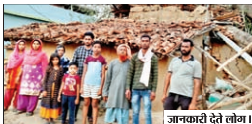
जानकारी देते लोग।