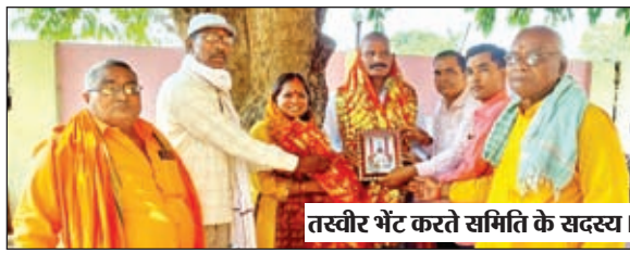
तस्वीर भेंट करते समिति के सदस्य।