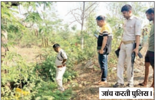
जांच करती पुलिस।