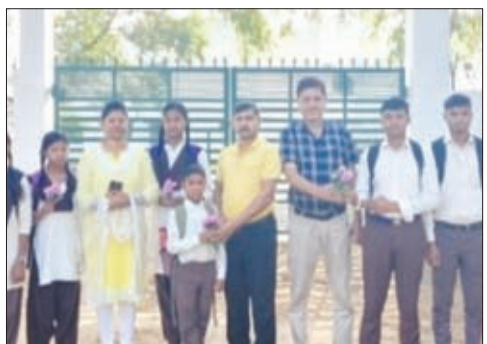
विद्यार्थियों को सम्मानित करते शिक्षक।