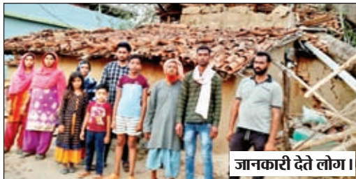
जानकारी देते लोग।