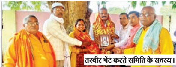
तस्वीर भेंट करते समिति के सदस्य।