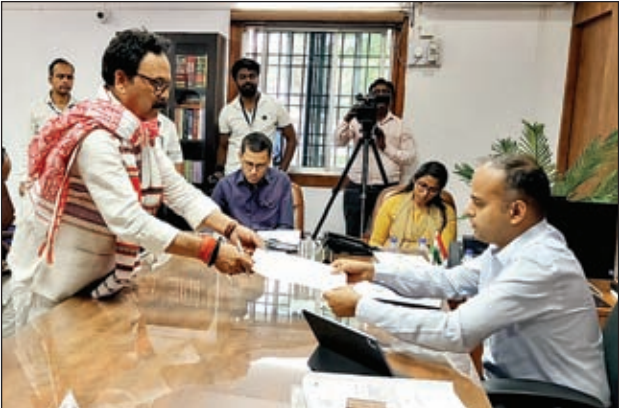
निर्वाची पदाधिकारी के समक्ष पर्चा दाखिल करते सुखदेव भगत।