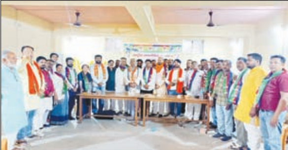
बैठक में उपस्थित कार्यकर्ता