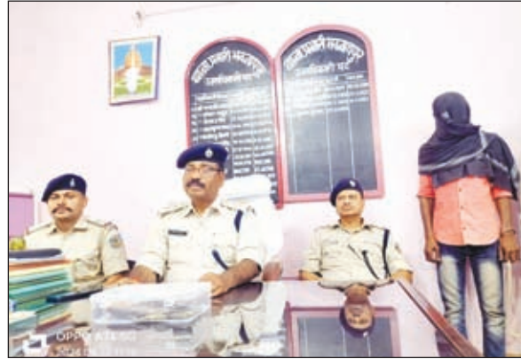
प्रेस कॉन्फ्रेंस करते एसडीपीओ