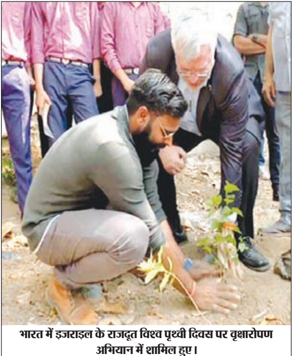
भारत में इजराइल के राजदूत विश्व पृथ्वी दिवस पर वृक्षारोपण अभियान में शामिल हुए।

नयी दिल्ली। रक्षा मंत्री राजनाथ सिंह ने दुनिया के सबसे ऊंचे युद्धक्षेत्र सियाचिन में तैनात सैनिकों की बहादुरी की सराहना करते हुए कहा है कि यह कोई साधारण भूमि नहीं, बल्कि भारत की संप्रभुता तथा दृढ़ संकल्प का प्रतीक है और इसकी रक्षा करने वाले सैनिकों का गौरवशाली इतिहास युवा पीढ़ी के लिए प्रेरणा का स्रोत रहेगा। सोमवार को दुनिया के सबसे ऊंचे युद्धक्षेत्र सियाचिन का दौरा करने के बाद श्री सिंह ने कहा कि जैसे दिल्ली भारत की राष्ट्रीय राजधानी है, मुंबई वित्तीय राजधानी है, और बंगलुरु प्रौद्योगिकी राजधानी है, वैसे ही सियाचिन साहस, धैर्य और दृढ़ संकल्प की राजधानी है।