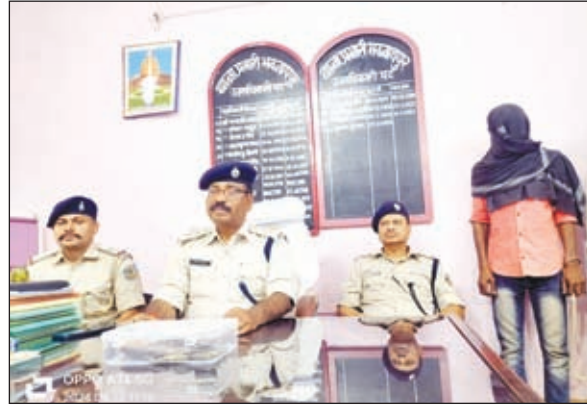
प्रेस कॉन्फ्रेंस करते एसडीपीओ