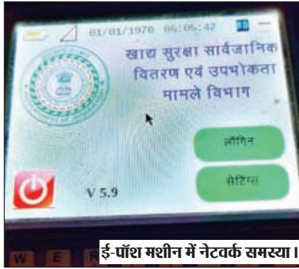
ई-पॉश मशीन में नेटवर्क समस्या।

चंदवा। प्रखंड क्षेत्र अंतर्गत कई जन वितरण प्रणाली के दुकानों में ई-पॉश मशीन से ऑनलाइन बायोमेट्रिक कार्य नहीं हो रही है। जिस कारण पीडीएस दुकानदार खाद्यान का वितरण नहीं कर पा रहे हैं। पूरे प्रखण्ड के लाभुक समय पर राशन नहीं मिलने से खासे परेशान हैं। लाभुक कहते हैं समय पर राशन के नहीं मिल पाने से हम लोगों का बजट गड़बड़ा जाता है। पॉस मशीन के नहीं खुल पाने की शिकायत डीलर संघ की ओर से उच्चाधिकारियों को की गयी है। पुराने और खराब पॉश मशीन को बदलकर नये 4-जी करने की मांग लगातार पूर्व में भी की गयी है। इस बाबत राज्य सरकार के द्वारा लोकसभा चुनाव के बाद मशीन को 4जी करने की अनुशंसा भी कर दी गयी है। फिलहाल इस समस्या से निजात नहीं मिलने की स्थिति में ससमय राशन वितरण की व्यवस्था चरमरा गई है। इस बाबत प्रभारी एमओ