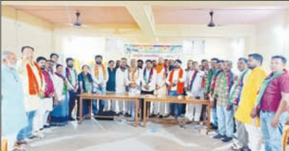
बैठक में उपस्थित कार्यकर्ता