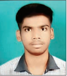
फोटो कैप्शन 8,9 और 10 विद्यालय के टॉपर