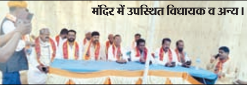
मंदिर में उपस्थित विधायक व अन्य ।

चैती नवरात्र के अवसर पर शिव मंदिर पहुंचे विधायक व जनप्रतिनिधि