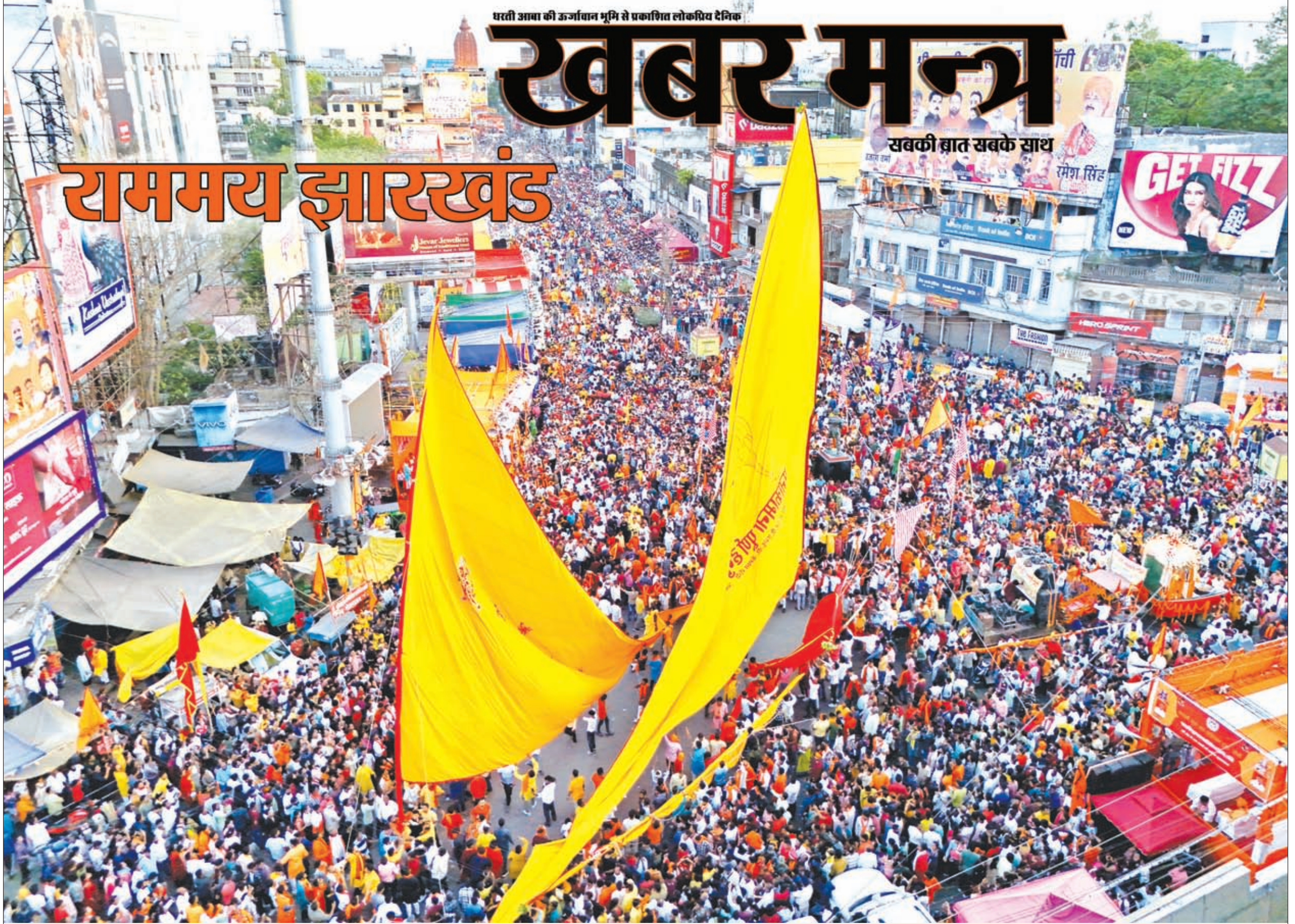
धरती आवा की उर्जावान मूमि से प्रकाशित लोकप्रिय दैनिक