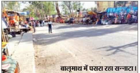
बालूमाथ में पसरा रहा सन्नाटा ।

बालूमाथ प्रखंड मुख्यालय में नहीं निकाला गया रामनवमी का जुलूस