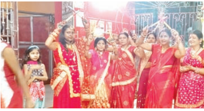
दक्षिणेश्वर काली मंदिर में डांडिया करती महिलाएं।

अनुरूप मैत्रीपूर्ण माहौल में पूजा संपन्न कराने को लेकर तैयार रहने का निर्देश दिया। उपायुक्त ने भी इस बार महासमितियों के द्वारा नशा मुक्त रामनवमी को लेकर किये गए प्रयासों की सराहना करते हुए कहा कि बेहतर माहौल में रामनवमी मनाएँ। प्रशासन हर संभव आपके साथ है लेकिन माहौल बिगाड़ने वाले उपद्रवियों पर सख्तों से निपटने की भी तैयारी कर ली