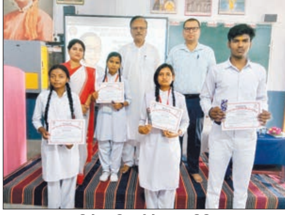
विजेता प्रतिभागी के साथ अतिथि