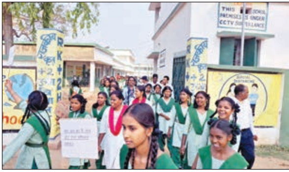
जागरूकता रैली में शामिल विद्यार्थी