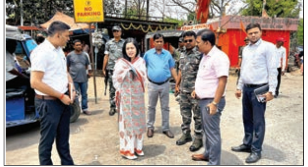
कार्यक्रम प्रस्तुत करते कथाकार व उपस्थित श्रद्धालु