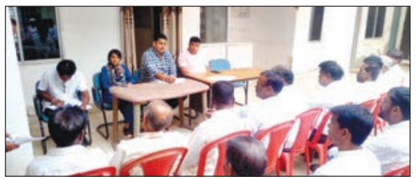
शांति समिति के बैठक में मौजूद लोग