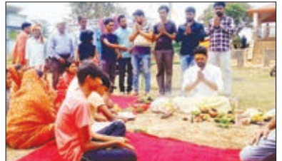
भूमि पूजन करते।

इटकी। इटकी के केशरी नया तालाब स्थित रुद्र महाकाल मंदिर परिसर में आगामी 7 से 13 मई तक श्री लक्ष्मी नारायण महायज्ञ सह भागवत कथा का लेकर