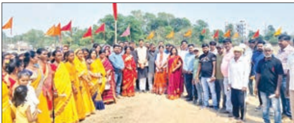
महावीर मंडल की बैठक में उपस्थित सांसद संजय सेठ।

नामकुम। महावीर मण्डल केंद्रीय समिति की बैठक नामकुम बाजार में हुई। कार्यक्रम में बतौर मुख्य अतिथि सांसद संजय सेठ मौजूद थे उपस्थित लोगों को संबोधित करते हुए सांसद श्री, सेठ ने कहा कि रामनवमी का उत्सव आपसी भाईचारा और प्रेम का प्रतीक है। पिता और भाई के प्रति राम कि भक्ति, भगवान-राम के प्रति भक्त की भक्ति दुनिया में मिशाल है। पहली बार देश प्रभु राम के अपने घर में आगमन के बाद रामनवमी उत्सव