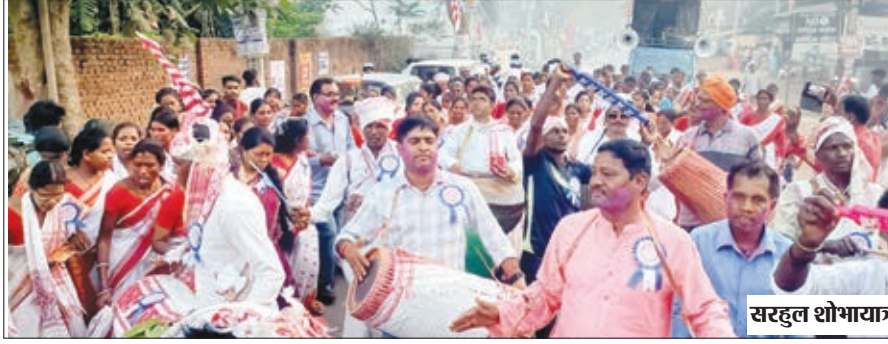
सरहुल शोभायात्रा में उमड़ी भीड़।

बेड़ो। सरहुल पूजा महासमिति बेड़ो के तत्वाधान में शनिवार को डोल ढांक नगाड़ा व मांदर के थाप पर पारम्परिक संस्कृति और वेशभूषा में झांकी के रूप में हजारों सरना आदिवासियों ने प्रकृति पर्व सरहुल की भव्य शोभा यात्रा और जुलूस निकाली। इस दौरान लोगों का जन सैलाब सड़कों पर उमड़ पड़ा? सरहुल जुलूस के दौरान बेड़ो प्रखंड के विभिन्न गांव से