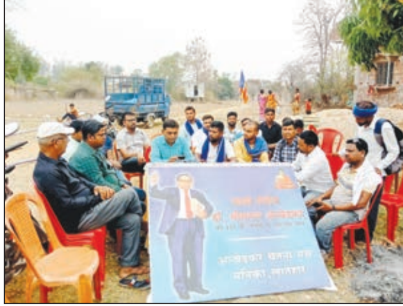
बैठक में उपस्थित लोग