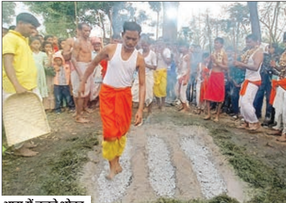
आग में चलते भोक्ता

राहे। प्रखंड के महेशपुर, नुरू, गोवाली और बेला गांव में शनिवार सुबह को हर्षोल्लास के साथ चैत्र पर्व व शिव पूजा संपन्न हो गया। इसके लेकर गांव के शिव मंदिर परिसर में शुक्रवार रात को मेले का आयोजन किया गया। जहां लोग रात भर छऊ नृत्य तथा मेले का आनंद लिया। वहीं शनिवार सुबह फूलखुंदी ( दहकते अंगारों में चलोना) का आयोजन किया गया। नुरू और गोवाली गांव में भोक्ता 50 फीट ऊंची हवा में झूलते हुये झूलन