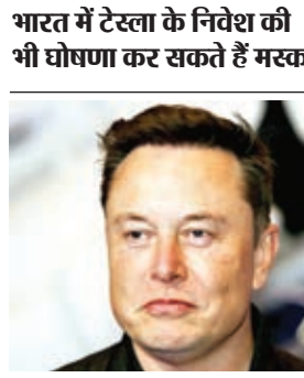
भारत में टेस्ला के निवेश की भी घोषणा कर सकते हैं मस्क

नयी दिल्ली। इलेक्ट्रिक कार बनाने वाली अमेरिकी कंपनी टेस्ला के मुख्य कार्यपालक अधिकारी (सीईओ) एलन मस्क इस महीने भारत दौरे पर आएंगे। अपनी भारत यात्रा के दौरान वह प्रधानमंत्री नरेंद्र मोदी से मुलाकात करेंगे। एलन मस्क ने एक्स हैंडल पोस्ट पर कहा है कि भारत में प्रधानमंत्री मोदी से मुलाकात के लिए उत्सुक हूँ। मस्क भारत में टेस्ला की निवेश योजनाओं की भी घोषणा कर सकते हैं। यह उनकी पहली भारत यात्रा होगी। इससे पहले प्रधानमंत्री नरेंद्र मोदी और मस्क अवतक दो बार मिल चुके हैं। पहली बार प्रधानमंत्री की 2015 में कैलिफोर्निया के टेस्ला फैक्ट्री में मस्क से मुलाकात हुई थी। इसके बाद जून 2023 में दोनों न्यूयॉर्क में मिले थे। उल्लेखनीय है, एलन मस्क अपनी कंपनी टेस्ला को भारतीय बाजार में