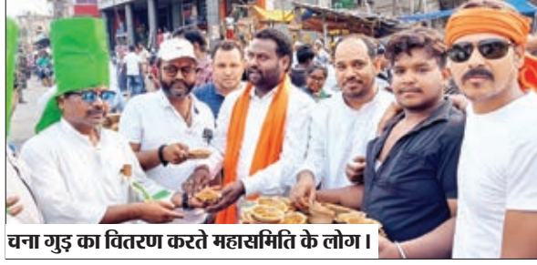
चना गुड़ का वितरण करते महासमिति के लोग।

ने कहा कि प्रकृति के महत्व को समझना होगा। पानी का दोहन किया जा रहा है। इसके संरक्षण के लिए कर कोई कार्य नहीं हो रही है। इसे बचाना जरूरी है। पेड़ का तेजी से कटाव हो रहा है। जिससे वर्षा कम हो रही है। इसे संरक्षण कर रखना जरूरी है। जिला परिषद