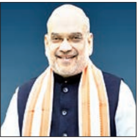
बिहार में सुशासन की सरकार : सभाट इससे पहले उपमुख्यमंत्री सभाट चौधरी ने जय श्रीराम के नारे से अपना संबोधन शुरू किया। उन्होंने कहा कि प्रधानमंत्री मोदी देश को विकसित कर रहे हैं। करोड़ों को आने ले जा रहे हैं। बिहार में डबल इंजन की सरकार है। बिहार की सरकार ने दो करोड़ लोगों को आयुजान कार्ड से जोड़ा। पांच करोड़ लोगों को मुक्त अनाज दिया। बिहार में सुशासन की सरकार है।

पटना। भारतीय जनता पार्टी के वरिष्ठ नेता एवं केंद्रीय गृहमंत्री अमित शाह ने कांग्रेस पार्टी पर जमकर हमला बोला है। उन्होंने कहा कि कांग्रेस की चार पीढ़ियां तृष्टिकरण करती आ रही हैं। कांग्रेस कह रही है सीएफ वापस करेंगे। कांग्रेस उत्तर भारत और दक्षिण भारत में तोड़ना चाहती है। कांग्रेस देश को कितनी बार तोड़ेगी। अमित शाह ने बुधवार को बिहार में गया जिले के गुरुआ में चुनावी सभा को संबोधित किया। इस दौरान उन्होंने कांग्रेस पर जमकर हमला बोला। साथ ही उन्होंने कहा सरकार की तारीफ की। शाह ने कहा कि कांग्रेस के जमाने में हर लोग पाकिस्तान से आलिया मालिया जमलिया आते थे। धमके करते थे। प्रधानमंत्री नरेन्द्र मोदी ने यह सब रोका। यह कांग्रेस की सरकार नहीं है, भाजपा की सरकार है, नरेंद्र मोदी की सरकार है। शाह ने उपस्थित जन समूह से पूछते हुए कहा कि राम मंदिर बनना चाहिए था नहीं? 74-75 सालों में लालू और गठबंधन के नेता