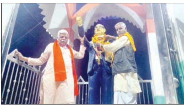
माल्यार्पण करते सांसद