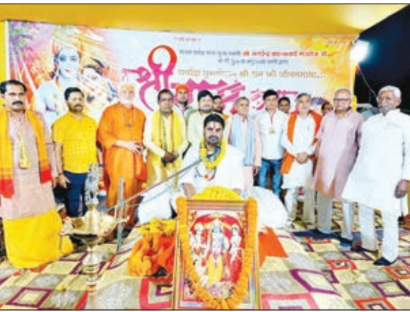
प्रवचन करते प्रपन्नाचार्य

ने मंगलाचरण के साथ रामचरित मानस की विशेषता एवं लोकप्रियता, भक्ति के तरीके, संतो एवं अंतों की प्रति पर विशेष रूप से प्रकाश डाला। उन्होंने कहा कि भगवान से भी बढ़ कर भगवदनाम की महिमा है। भगवान ने तो कुछ ही लोगों का उद्धार किया लेकिन भगवदनाम आज भी करोड़ों लोगों के उद्धार