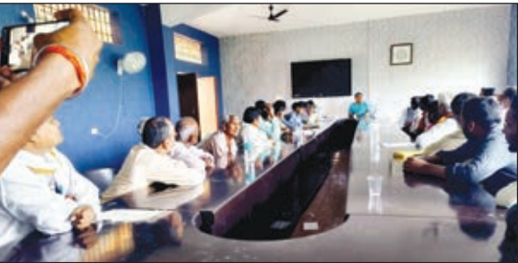
बैठक करते एसडीओ