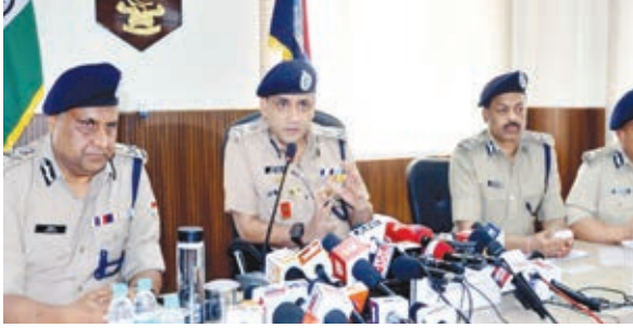
उत्तराखंड के डीजीपी ने प्रेसवार्ता में दी जानकारी।