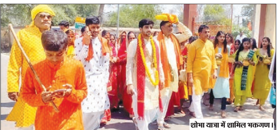
शोभा यात्रा में शामिल भक्तगण।