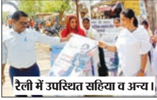
रैली में उपस्थित सहिया व अन्य।