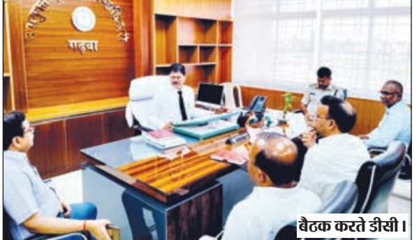
बैठक करते डीसी।