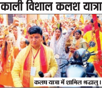
कलश यात्रा में शामिल श्रद्धालु।