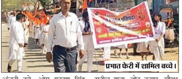
प्रभात फेरी में शामिल बच्चे।

भवनाथपुर। हिंदू नव वर्ष के अवसर पर प्रखंड के मंदिरों में सुबह से ही पूजा अर्चना करने वालों की भीड़ लगी रही। वही सरस्वती शिशु मंदिर भवनाथपुर के बच्चों के द्वारा पथ संचलन कर वर्ष प्रतिपदा मनाया गया। इस दौरान बच्चे नववर्ष मंगलमय हो, जय श्री राम, वंदे मातरम, भारत माता की जय का जय घोष लगा रहे थे। पथ संचलन करने वाले बच्चों को किसी तरह का दिक्कत ना हो इसके लिए भवनाथपुर व्यवसायिक संघ के सदस्यों ने जगह जगह स्टॉल लगाया गया था। कर्पूर चैक पर कमलेश होटल ने बच्चों को शरबत पिलाई, वन विभाग के चेकनाका के पास व्यवसायी वॉरेंड सेट,