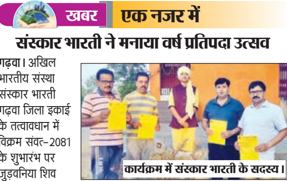
कार्यक्रम में संस्कार भारती के सदस्य।