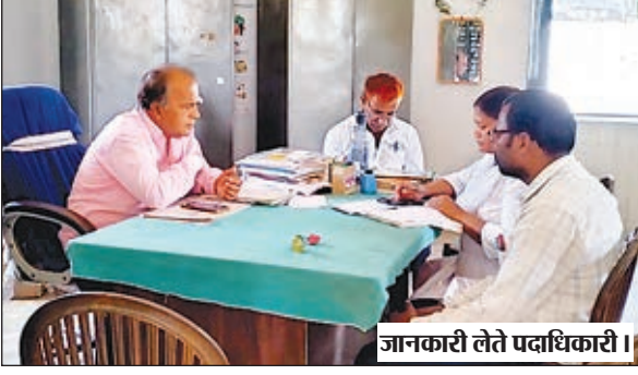
ज्ञानकारी लेते पदाधिकारी।

रमना। प्रखंड के माध्यमिक मध्य विद्यालय सिलीदाग विद्यालय में दिन ब दिन शिक्षा का स्तर गिरता जा रहा है। जिससे विद्यालयों में छात्रों की उपस्थिति कम होते जा रहा है। मध्यम वर्गीय लोग निजी विद्यालयों में अपने बच्चों को पढ़ाने के लिए विवश है। सरकार द्वारा समुचित शिक्षा व्यवस्था के लिए बजट को बढ़ाया जा रहा है। लेकिन ये खर्च कहाँ जा रहे है। विद्यालयों में समुचित शिक्षा का व्यवस्था नहीं हो पा रहा है और शिक्षा स्तर निम्न से निम्नतर होते जा रहा है। अविभाजक सरकारी विद्यालयों में