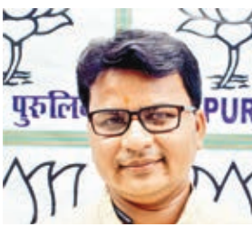
ज्योतिर्मय सिंह महतो।

1967 में आईएनडी के बी महतो सांसद चुने गए। 1971 में पहली बार यहां से कांग्रेस को यहां सफलता मिली और देवेन्द्र नाथ महतो यहां से सांसद चुने गए थे। 1977 में एफबीएल के चितरंजन महतो को सफलता मिली थी। चितरंजन 1980, 1984 और 1989 तक पुरुलिया से लगातार सांसद चुने जाते रहे। 1991 में यहां पर उप चुनाव हुआ जिसमें फॉरवर्ड ब्लॉक के बी महतो सांसद चुने गए। 1996, 1998, 1999 में फॉरवर्ड ब्लॉक