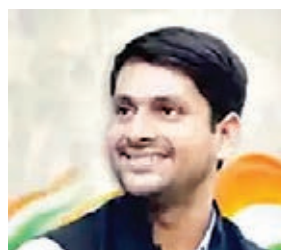
शांति राम महतो

1967 में आईएनडी के बी महतो सांसद चुने गए। 1971 में पहली बार यहां से कांग्रेस को यहां सफलता मिली और देवेन्द्र नाथ महतो यहां से सांसद चुने गए थे। 1977 में एफबीएल के चितरंजन महतो को सफलता मिली थी। चितरंजन 1980, 1984 और 1989 तक पुरुलिया से लगातार सांसद चुने जाते रहे। 1991 में यहां पर उप चुनाव हुआ जिसमें फॉरवर्ड ब्लॉक के बी महतो सांसद चुने गए। 1996, 1998, 1999 में फॉरवर्ड ब्लॉक