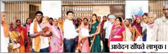
आवेदन सौंपते लाभुक।