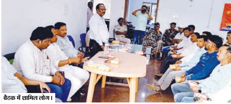
बैठक में शामिल लोग।