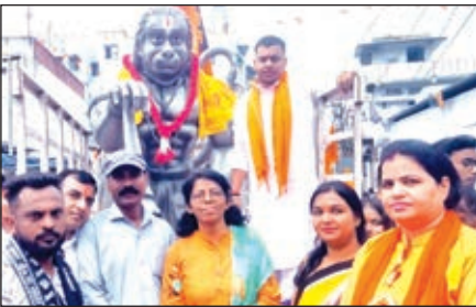
हिन्दू नववर्ष के मौके पर जुगसलाई में शोभा यात्रा में शामिल गणमान्य व्यक्ति।

इधर, प्रशासन शांति पूर्ण ढंग से जुलूस निकलवाने के लिए पूरी तरह दिन भर मुस्तैद रहा। चिन्हित जगहों पर बैरिकेटिंग किया गया था ताकि आप लोगों को ज्यादा परेशानी ना हो। दोपहर बाद डिमना से यात्रा निकलने के बाद मानगो गोलचक्कर क्षेत्र गेरुआ झंडा से पट्ट गया और जय श्रीराम से गुंज उठा। रवि सिंह एंड टीम को गांधी मैदान तो दूर दवाईगुट्ट बड़ा हनुमान मंदिर