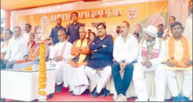
मंवासीन प्रदेश अध्यक्ष बाबूलाल मरांडी व अन्य