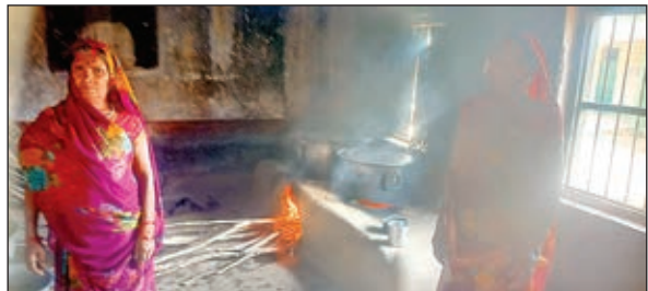
लकड़ी पर बनता मध्याह्न भोजन