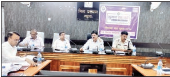
बैठक करते डीसी व अन्य

गढ़वा। जिला निर्वाचन पदाधिकारी सह डीसी शेखर जमुआर ने शनिवार को समाहरणालय स्थित सभागार में लोकसभा आम निर्वाचन 2024 की तैयारी एवं अब तक की गई कार्रवाई के निमित्त विभिन्न कोषांगों द्वारा किए जा रहे कार्यों की समीक्षा बैठक की। इस दौरान जिला निर्वाचन पदाधिकारी ने लोकसभा आम निर्वाचन को लेकर गठित सभी कोषांगों के नोडल पदाधिकारियों से किए जा रहे कार्यों की समीक्षा की। इनमें मुख्य रूप से पर्सनल एवं कंप्यूटराइजेशन सेल, इलेक्ट्रोनल सेल एवं इवीएम मैनेजमेंट सेल, ट्रेनिंग सेल, एमसीसी, एमसीएमसी, ल एंड अर्डर सेल, कंप्लेन मनिटरिंग सेल, इलेक्शन एक्सपेंडिचर मनिटरिंग सेल, स्वीप सेल, आईटी सेल, पोस्टल बैलट, इडीसी सेल, मीडिया एवं पब्लिसिटी सेल, मेटेरियल डिस्ट्रीब्यूशन सेल, कंट्रोल रूम एवं