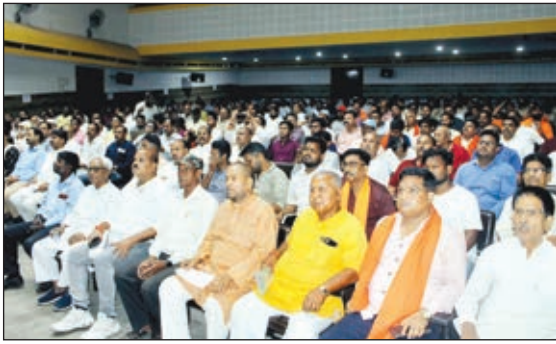
जो अश्लील हो या धार्मिक उन्माद फैलाये, जिससे शांति का माहौल खराब हो। जिला प्रशासन सोशल मीडिया पर सख्त निगरानी रखेगी, सावधानी से सोशल मीडिया का उपयोग करें, किसी तरह के अफवाहों पर ध्यान नहीं दें, ग्रामक