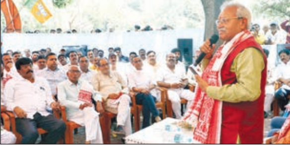
पार्टी स्थापना दिवस समारोह को संबोधित करते झारखंड भाजपा प्रभारी लक्ष्मीकांत वाजपेयी।

जमशेदपुर। विश्व की सबसे बड़ी राजनीतिक पार्टी भारतीय जनता पार्टी ने शनिवार को अपना 45वां स्थापना दिवस मनाया। दिल्ली से लेकर रांची एवं जमशेदपुर महानगर और जनसेवा का संकल्प लिया। साकची स्थित भाजपा जिला कार्यालय में भाजपा जमशेदपुर