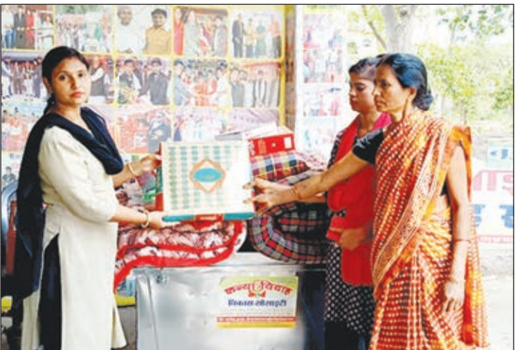
विदाई सामग्री देती संस्था के सदस्य