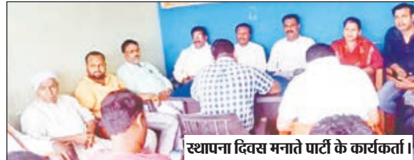
स्थापना दिवस मनाते पार्टी के कार्यकर्ता।