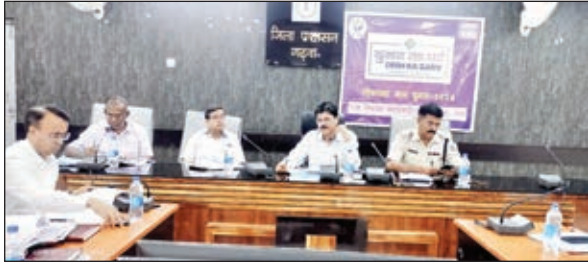
बैठक करते डीसी व अन्य

गढ़वा। जिला निर्वाचन पदाधिकारी सह डीसी शेखर जमुआर ने शनिवार को समाहणालय स्थित सभागार में लोकसभा आम निर्वाचन 2024 की तैयारी एवं अब तक की गई कार्रवाई के निमित्त विभिन्न कोषांगों द्वारा किए जा रहे कार्यों की समीक्षा बैठक की। इस दौरान जिला निर्वाचन पदाधिकारी ने लोकसभा आम निर्वाचन को लेकर गठित सभी कोषांगों के नोडल पदाधिकारियों से किए जा रहे कार्यों की समीक्षा की। इनमें मुख्य रूप से पर्सनल एवं कंप्यूटराइजेशन सेल, इलेक्ट्रोनल सेल एवं इवीएम मैनेजमेंट सेल, ट्रेनिंग सेल, एमसीसी, एमसीएमसी, ल एंड अर्डर सेल, कंप्लेन मनिटरिंग सेल, इलेक्शन एक्सपेंडिचर मनिटरिंग सेल, स्वीप सेल, आईटी सेल, पोस्टल बैलट, इडीसी सेल, मीडिया एवं पब्लिसिटी सेल, मेटेरियल डिस्ट्रीब्यूशन सेल, कंट्रोल रूम एवं