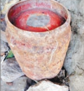
बरामद किया गया सिलेंडर बम।

बताया जाता है कि गारू के बारीबान्ध जंगलों में नक्सलियों का गढ़ माना जाता था। जिसके लेकर नक्सलियों द्वारा आगामी लोकसभा चुनाव को लेकर सुरक्षा बलों को निशाना बनाने एवं चुनाव में खलल डाल के लिए जंगलों में बम छिपा कर रखा गया। वही सुरक्षा बलों ने