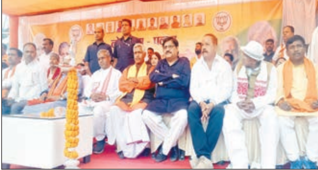
मंवासीन प्रदेश अध्यक्ष बाबूलाल मरांडी व अन्य