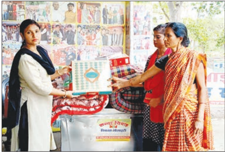
विदाई सामग्री देती संस्था के सदस्य