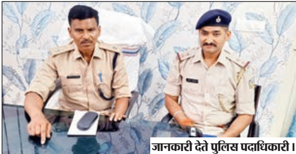
जानकारी देते पुलिस पदाधिकारी।