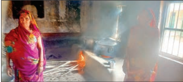
लकड़ी पर बनता मध्याह्न भोजन