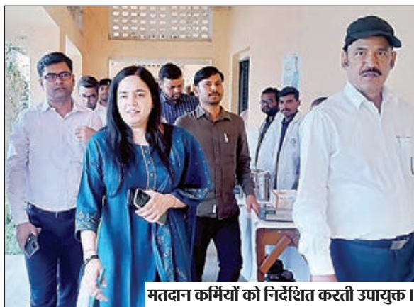
मतदान कर्मियों को निर्देशित करती उपायुक्त।

लातेहार। जिला निर्वाचन पदाधिकारी सह उपायुक्त गरिमा सिंह की अध्यक्षता में लोकसभा आम चुनाव, 2024 को शांतिपूर्ण, निष्पक्ष तरीके से संपन्न कराने के उद्देश्य से गांधी इंटर कॉलेज, बनवारी साहू कॉलेज, लातेहार में प्रथम मतदान पदाधिकारियों को प्रशिक्षण दिया गया। शुक्रवार को आयोजित प्रशिक्षण में जिला निर्वाचन पदाधिकारी ने आसन्न लोकसभा आम चुनाव के दौरान किए जाने वाले कार्यों व कर्तव्यों से सभी को अवगत कराया। आगे लेकर उन्होंने कहा कि लोकसभा आम निर्वाचन के तहत लातेहार जिला में पांचवे चरण में चुनाव होना है। ऐसे में चुनाव के दौरान आपके द्वारा की गई एक चूक या कार्यों से संबंधित अपर्याप्त ज्ञान मतदान केंद्रों पर होने वाले मतदान प्रक्रिया को प्रभावित कर सकता है। इसलिए आप सभी बेहद सजोदगी के साथ प्रशिक्षण प्राप्त करें। साथ ही चुनाव में बरतने वाली