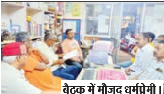
बैठक में मौजूद धर्मप्रेमी।

चैती के छठ के साथ-साथ चैत्र नवरात्र, श्री रामनवमी व सरहुल के मौके पर भी सुविधा उपलब्ध कराएगी संस्थान