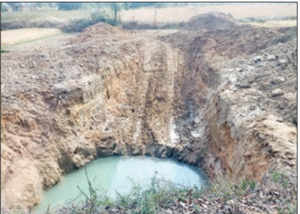
कुआं की खुदाई