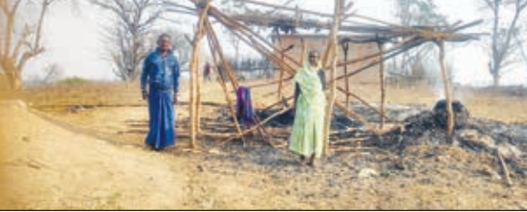
आग लगने से जला झाला