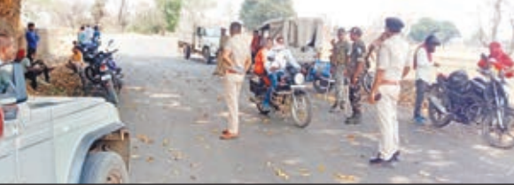
वाहन की जांच करते थाना प्रभारी