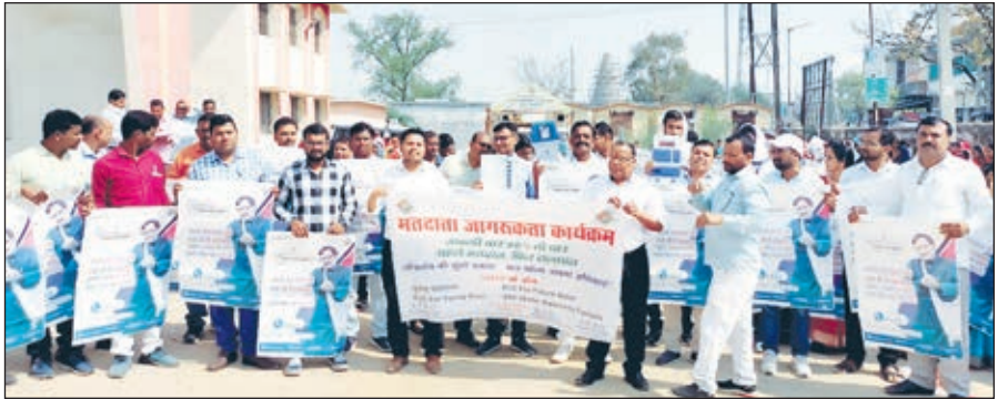
जागरूकता रैली में शामिल लोग