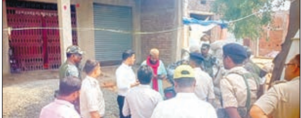
जांच करती टीम