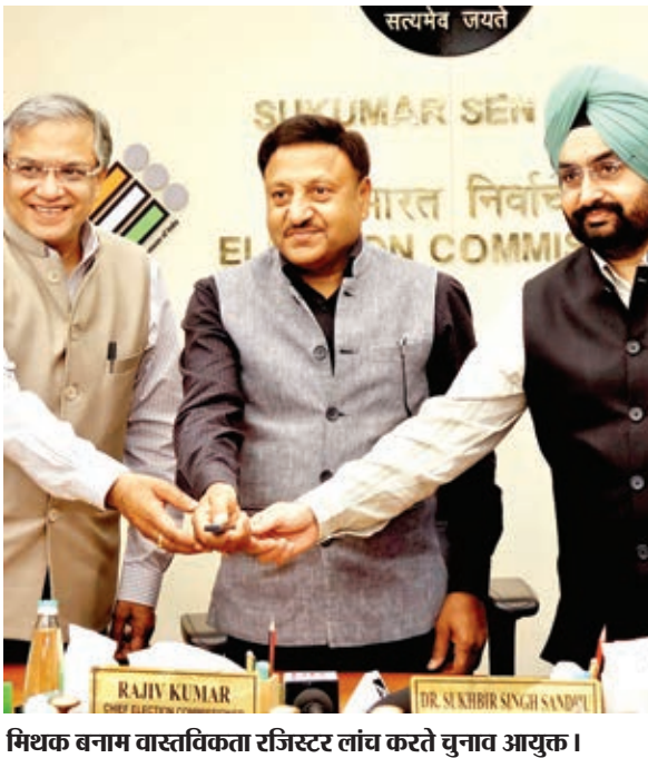
मिथक बनाम वास्तविकता रजिस्टर लांच करते चुनाव आयुक्त।

जीव-जंतुओं की बड़ी संख्या है, कई विशाल जानवर भी हैं। इस बीच अंबा नाम की बाघिन अपने बच्चों की देखभाल कर रही है।