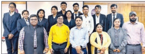
मेडिका बाजार में चयनित छात्र-छात्राएँ एवं शिक्षकगण।

जमशेदपुर। अरका जैन यूनिवर्सिटी में देश के सबसे बड़े ऑनलाइन मेडिकल सप्लाइ प्लेटफॉर्म बी 2 बी 'मेडिकबाजार टेक फर्स्ट' की ओर से कैम्पस प्लेसमेंट ड्राइव चलाया गया। इस प्लेसमेंट ड्राइव में यूनिवर्सिटी के एमबीए, बी फार्मा, डी फार्मा और बीएससी बायोटेक्नोलॉजी के छात्रों ने हिस्सा लिया। विभिन्न चरण की चयन प्रक्रिया के पश्चात कंपनी की ओर से यूनिवर्सिटी के 13 छात्र-छात्राओं का अंतिम रूप से चयन किया गया। प्रत्येक छात्र-छात्रा को कंपनी की ओर से 3.15 लाख रुपये सालाना के पैकेज पर लॉक किया गया है। सालाना उक्त राशि के अलावा अन्य भत्ता आदि भी दिया जायेगा। इनका