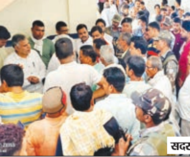
सदर अस्पताल में लगी भीड़ ।