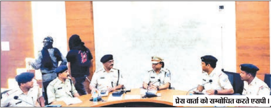
प्रेस वार्ता को सम्बोधित करते एसपी ।