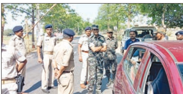
घाटशिला एसडीओ द्वारा की गई एक अन्य कार्रवाई में धालभूमगढ़ प्रखंड में सरकारी शराब दुकान के आड़ में नकली शराब का टैग, राशि का टैग, लेबल, सील स्टिकर, 857 से ज्यादा खाली बोतलें, ढक्कन, 14.5 ली. स्प्रिट, 31 रम बोतल के

थाना क्षेत्र अंतर्गत कश्मार पंचायत के ग्राम गोलकाटा में अवैध शराब भट्टी को ध्वस्त कराया। वहीं बौडीओ सह सीओ गुडुबांदा ने थाना प्रभारी के साथ छापेमारी अभियान चलाते हुए गुडुा ग्राम से अवैध महुआ शराब बनाने की भट्टी को ध्वस्त कराया।