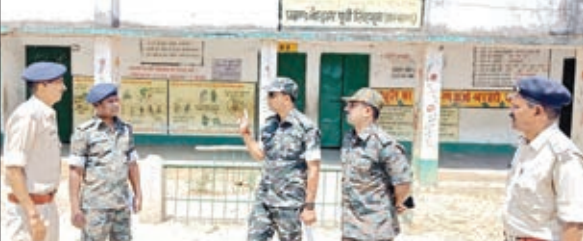
एसएसपी ने पटमदा, बोड़ाम में चेक नाकों का किया निरीक्षण

जमशेदपुर। शांतिपूर्ण माहौल में लोकसभा चुनाव- 2024 संपन्न कराने हेतु वरीय पुलिस अधीक्षक के द्वारा पुलिस अधीक्षक ग्रामीण, पुलिस उपाधीक्षक पटमदा के साथ ग्रामीण थाना क्षेत्र अंतर्गत पटमदा, बोड़ाम, कमलपुर के क्लस्टर एवं बूथो का निरीक्षण किया गया साथ