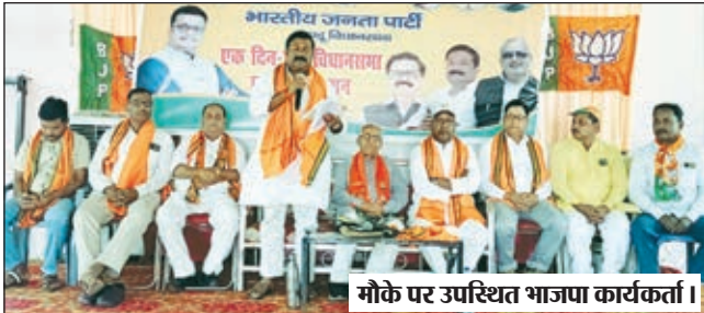
मौके पर उपस्थित भाजपा कार्यकर्ता।