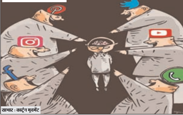
खानार : कार्टून मूवमेंट