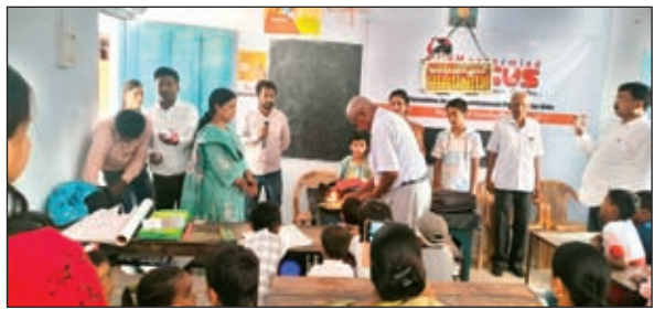
उद्घाटन करते अतिथि