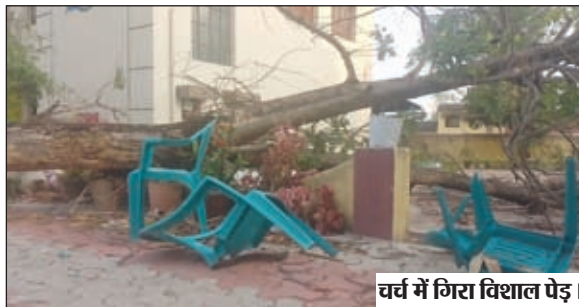
वर्च में गिरा विशाल पेड़।