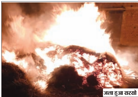
जला हुआ सरसों।