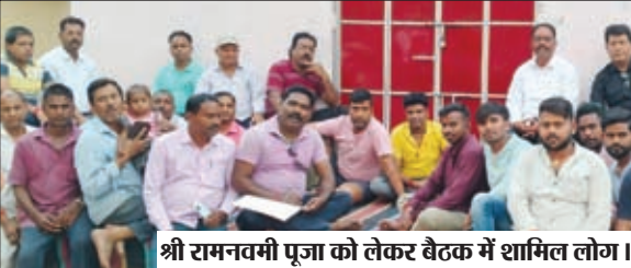
श्री रामनवमी पूजा को लेकर बैठक में शामिल लोग।