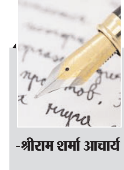
-श्रीराम शर्मा आचार्य

पूर्व कृत पापों के नष्ट होने का संबंध उन कर्मों से जिनका अभी परिपाक नहीं हुआ है, जो अभी संचित रूप में पड़े हैं और समयानुसार फलित होने के लिए जो सुरक्षित रखे हुए हैं। वर्तमान काल में यदि अधिक बलवान, शुभकर्म किये जाय, मन में यदि उच्चकोटि की सतो गुणी भावनाओं का प्रकाश प्रज्वलित रहे तो उसके तेज से, ऊष्मा से वह अशुभ संचय झुलसने लगता है और हत प्रभ हीन वीर्य होने लगता है।