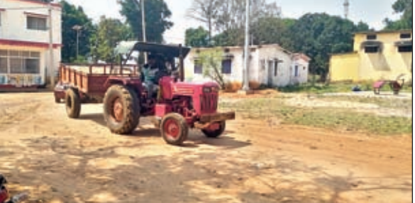
अवैध बालू लदा जल ट्रैक्टर