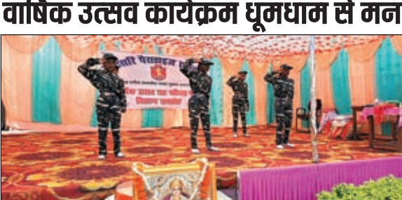
कार्यक्रम में नृत्य प्रस्तुत करती छात्राएं