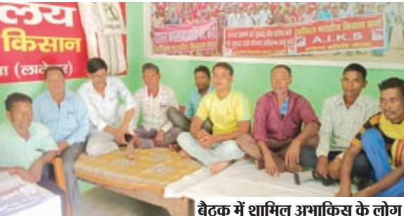
बैठक में शामिल अभाकिस के लोग।