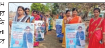
जागरूक करते सखी मंडल व अन्य।

लातेहार। लोकसभा आम निर्वाचन 2024 में शत प्रतिशत मतदान सुनिश्चित करने के उद्देश्य से स्वीप मतदाता जागरूकता कार्यक्रम के तहत जिले अंतर्गत विभिन्न गतिविधियों का आयोजन कर