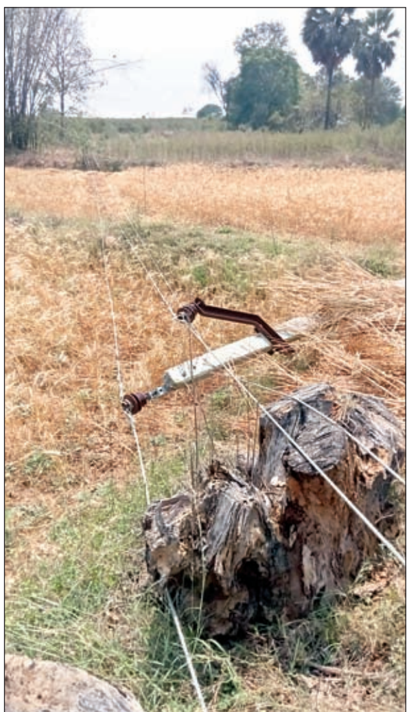
बिजली का गिरा पोल