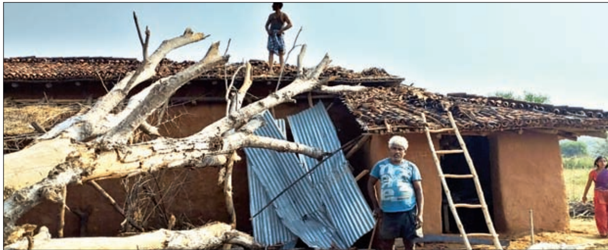
गिरा हुआ घर दिखाता ग्रामीण

भवनाथपुर। शनिवार की रात आयी तूफान ने भवनाथपुर में भारी तबाही मचाई है। तेज हवा के साथ आयी तूफान ने सेल के टाउनशिप स्थित आवासीय परिसर में आधा दर्जन बिजली पोल ध्वस्त कर दिया। जिस कारण रात से ही बिजली ब्लैक आउट है। इसके अलावे भवनाथपुर प्रखंड में भी