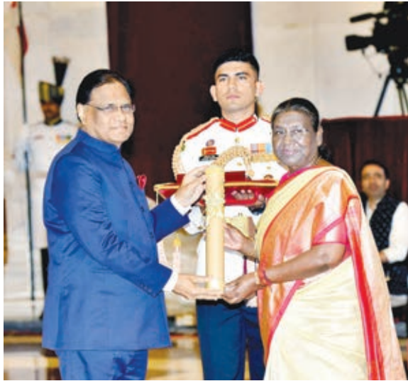
पूर्व पीएम नरसिम्हा राव के पुत्र को भारत रत्न देती राष्ट्रपति।