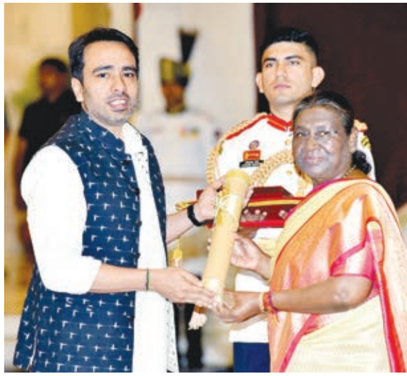
पूर्व पीएम चौधरी चरण सिंह के पुत्र सर्वोच्च सम्मान देती राष्ट्रपति।