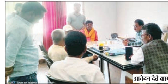
आवेदन देते ग्रामीण ।