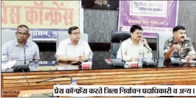
प्रेस कॉन्फ्रेंस करते जिला निर्वाचन पदाधिकारी व अन्य ।

जिला निर्वाचन पदाधिकारी ने बताया कि 13 पलामू लोकसभा क्षेत्र में चैथे फेज में चुनाव होना है। जिसके