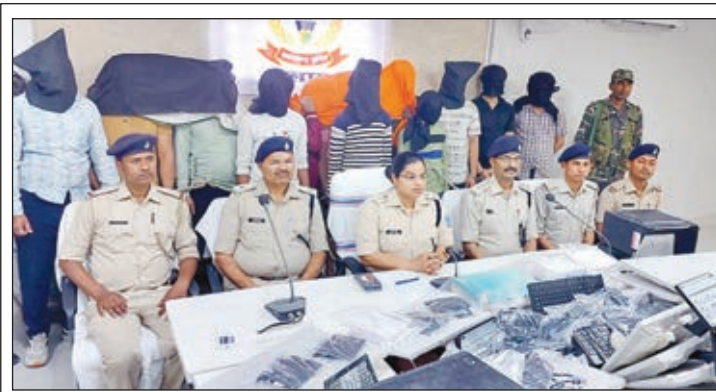
गिरफ्तार अपराधियों को मीडिया के समक्ष प्रस्तुत करते प्रशासनिक अधिकारी।

मेदिनीनगर। साइबर अपराधियों का शिकार आये दिन कोई न कोई व्यक्ति होता ही रहा है लेकिन साइबर अपराधी पुलिस के पकड़े से बचते रहे। पलामू में भी साइबर अपराधियों के जाल में कई लोग फंस चुके हैं। जिसकी सूचना साइबर थाना को दी गयी है। इसी बीच पलामू जिला में साइबर अपराधियों का एक बहुत बड़ा रैकेट सदर थाना क्षेत्र के चियांकी में सक्रिय था। जिसे गुप्त सूचना के आधार पर पुलिस ने छापेमारी कर 13