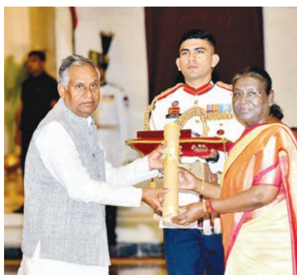
बिहार के पूर्व सीएम कर्पूरी ठाकुर के पुत्र को सम्मान देती मुर्मू।