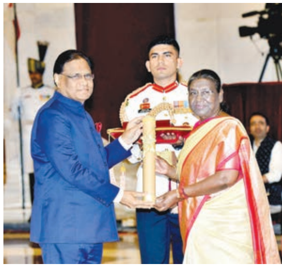
पूर्व पीएम नरसिम्हा राव के पुत्र को भारत रत्न देती राष्ट्रपति।