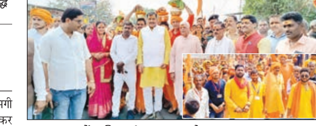
कलश यात्रा में शामिल सांसद व अन्य लोग।

यज्ञ के हवन से निकले धुआं से वातावरण शुद्ध होता है। धार्मिक आयोजन में सभी को शामिल होने की जरूरत है। कहा कि धार्मिक आयोजन से क्षेत्र में शांति व समृद्धि आती है। कलश शोभा यात्रा गाजे बाजे के साथ रेलवे स्टेशन होते हुये कोयल नदी तट पहुंचा, जहां वैदिक मंत्रोच्चारण के बीच कलश में जल भरा गया। इसके बाद नगर भ्रमण करते हुये यात्रा वापस यज्ञशाला