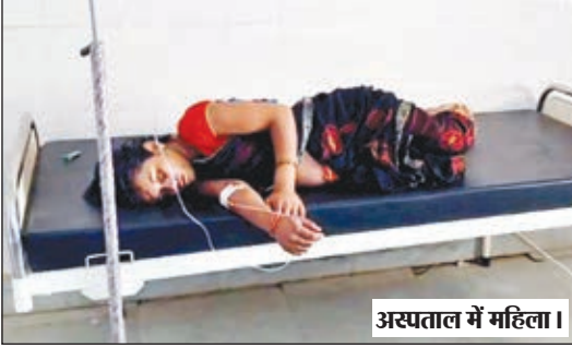
अस्पताल में महिला।