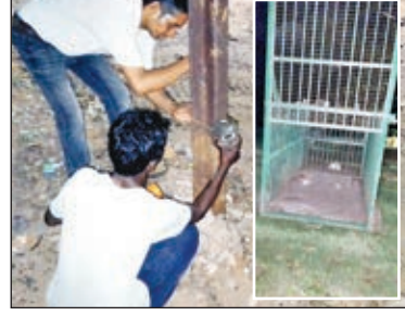
कदमा बायो डावर्सिटी पार्क में मोशन कैमरा और पिंजड़ा लगाती वन विभाग की टीम और गाड़ से जानकारी लेने के बाद रणनीति बनाते अधिकारी।