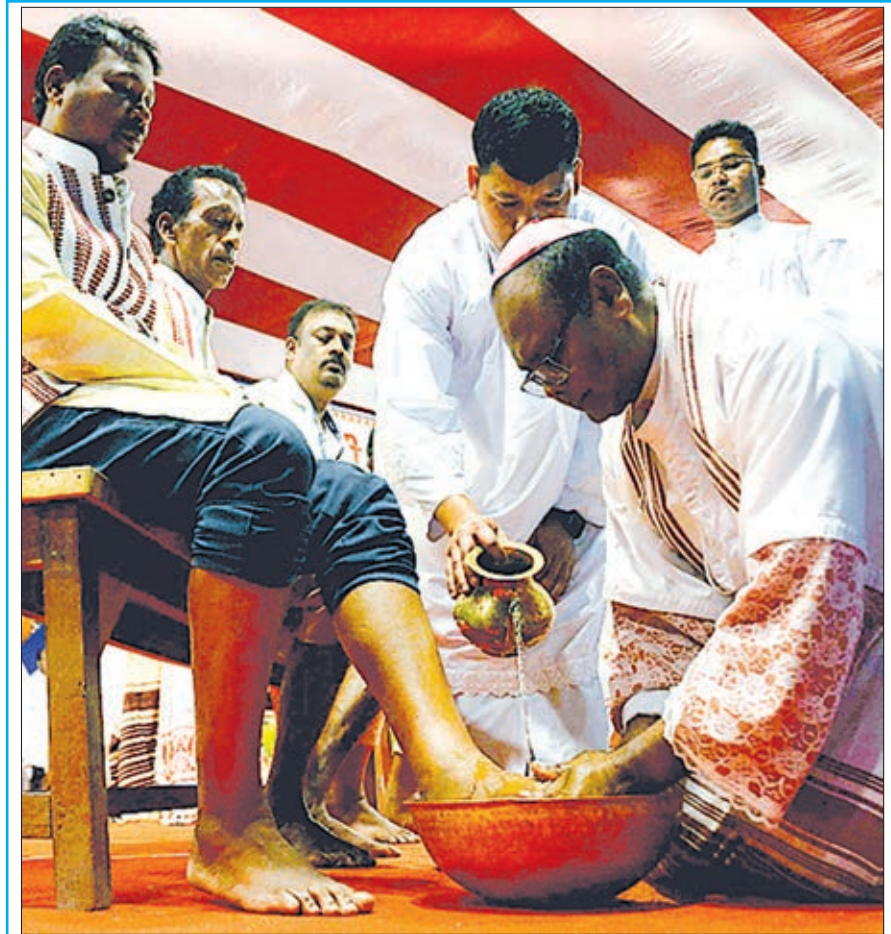
राजधानी रांची में ईस्टर की पूर्व संध्या पर गुरुवार को लोयला मैदान में प्रार्थना के बाद 12 वेलों का आरंभ शुरू हो चुका है।

हाल में किसी प्रकार का गैर कानूनी सामान ना उधर से आना चाहिए ना इधर से जाना चाहिए। एसाएसपी ने एसाएसपीओ और थानेदार को यह भी कहा कि जो भी अपराधी व नक्सली इलाके में सक्रिय हैं, उसकी पूरी जन्म कुंडली को खंगालते हुए रिपोर्ट सुपुर्द करें। एसाएसपी ने कहा कि भयमुक्त माहौल में मतदान करवाना है। ऐसे में जनता के बीच जाकर मतदान के प्रति लोगों को जागरूक करना भी जरूरी है।