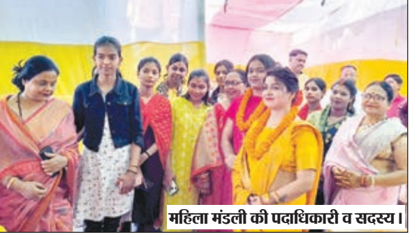
महिला मंडली की पदाधिकारी व सदस्य।

बैठक में श्री रामनवमी पूजा महासमिति जेनरल सहित अन्य अखाड़ों के साथ समन्वय