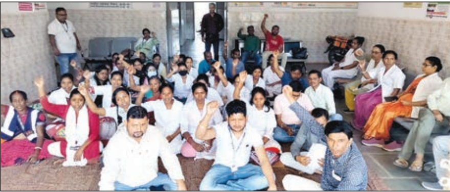
अस्पताल में सुरक्षा व्यवस्था की मांग को लेकर घटना पर बैठे चिकित्सा कर्मी।