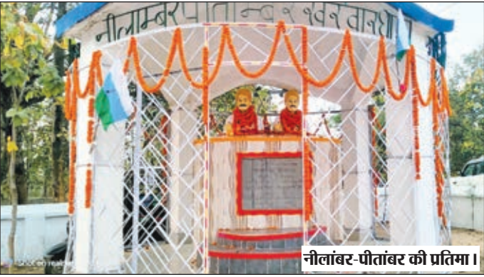
नीलांबर-पीतांबर की प्रतिमा।

भंडरिया। खरवार आदिवासी एकता संघ के बैनर तले गुरुवार को भंडरिया क्षेत्र के अंडा महुआ में स्थापित वीर शहीद नीलांबर पीतांबर की प्रतिमा पर खरवार आदिवासी एकता संघ के लोगों ने माल्यार्पण कर नीलांबर पीतांबर का 165वां शहादत दिवस मनाया। साथ ही प्रखंड क्षेत्र के विभिन्न गांव के बैगा पाहन व नीलांबर पीतांबर के वंशजों के द्वारा विधिवत पूजा अर्चना करने के उपरान्त अंडा महुआ स्थित वीर शहीद नीलांबर पीतांबर खरवार धाम की स्थापना की गई। वहीं भव्य मेले का आयोजन भी किया गया। कार्यक्रम की शुरुआत में खरवार समाज के लोगों के द्वारा भंडरिया प्रखंड के नौका गांव स्थित परभन बाबा देव स्थल से अंडा महुआ तक चार पहिया