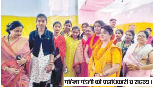
महिला मंडली की पदाधिकारी व सदस्य।

बैठक में श्री रामनवमी पूजा महासमिति जेनरल सहित अन्य अखाड़ों के साथ समन्वय