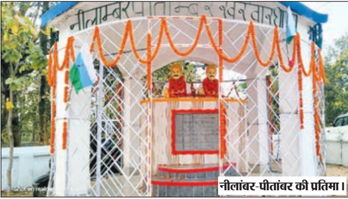
नीलांबर-पीतांबर की प्रतिमा।

भंडरिया। खरवार आदिवासी एकता संघ के बैनर तले गुरुवार को भंडरिया क्षेत्र के अंडा महुआ में स्थापित वीर शहीद नीलांबर पीतांबर की प्रतिमा पर खरवार आदिवासी एकता संघ के लोगों ने माल्यार्पण कर नीलांबर पीतांबर का 165वां शहादत दिवस मनाया। साथ ही प्रखंड क्षेत्र के विभिन्न गांव के बैगा पाहन व नीलांबर पीतांबर के वंशजों के द्वारा विधिवत पूजा अर्चना करने के उपरान्त अंडा महुआ स्थित वीर शहीद नीलांबर पीतांबर खरवार धाम की स्थापना की गई। वहीं भव्य मेले का आयोजन भी किया गया। कार्यक्रम की शुरुआत में खरवार समाज के लोगों के द्वारा भंडरिया प्रखंड के नौका गांव स्थित परभन बाबा देव स्थल से अंडा महुआ तक चार पहिया