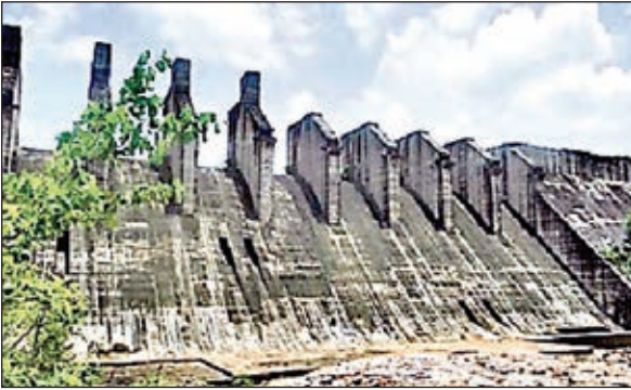
मंडल डेम व चिरमिरी लाइन

पंच वर्ष पूर्व पीएम ने किया था डेम का शिलान्यास : कई दशकों से अधूरे पड़े मंडल डेम के