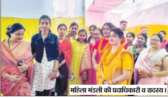
महिला मंडली की पदाधिकारी व सदस्य।

बैठक में श्री रामनवमी पूजा महासमिति जेनरल सहित अन्य अखाड़ों के साथ समन्वय