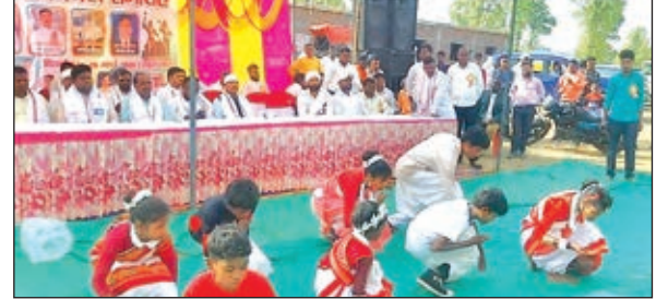
मौके पर मौजूद लोग