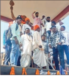
प्रतिमा पर माल्यार्पण करते कार्यकर्ता