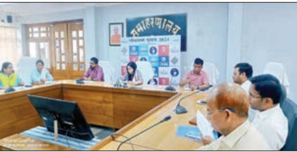
बैठक करते डीसी व अन्य