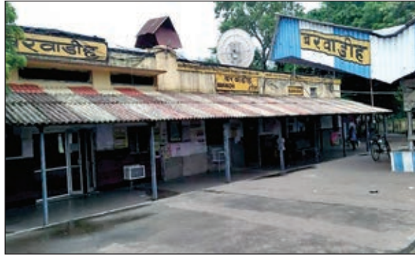
मंडल डेम व चिरमिरी लाइन

लातेहार जिलेवासियों के लिए नए युग की होगी शुरुआत : इधर लोगों की माने तो मंडल डेम के साथ-साथ चिरमिरी लाइन का कार्य पूर्ण होने से झारखंड और खासकर