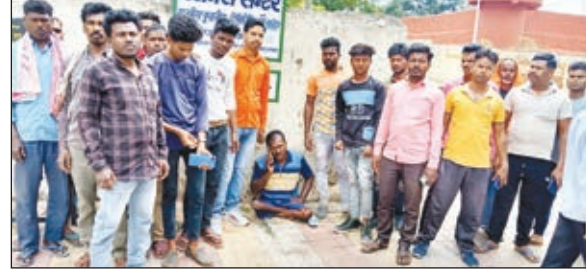
सदर अस्पताल पहुंचे परिजन