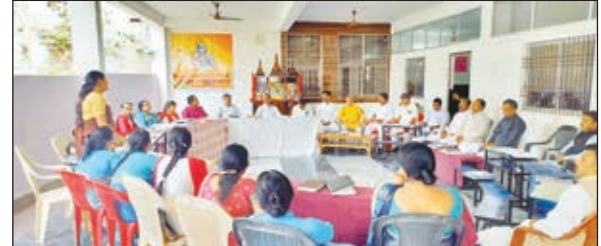
कार्यशाला में उपस्थित लोग