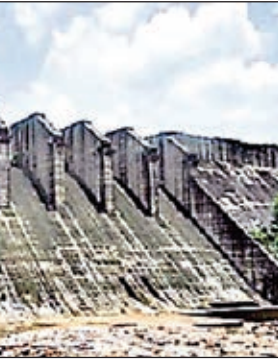
मंडल डेम व चिरमिरी लाइन

कार्य को पूर्ण करने की बातें 2009 लोकसभा चुनाव के पहले से चली आ रही हैं। वहीं पांच वर्ष पूर्व 5 जनवरी 2019 को पीएम नरेंद्र मोदी ने पलामू आकर इस अधूरी पड़ी बहुउद्देशीय परियोजना का ऑनलाइन शिलान्यास किया था। आज शिलान्यास के पांच वर्ष बीत जाने के बाद भी इस डेम के निर्माण में एक ईंट तक नहीं रखी गई है। जिस कार्य का शिलान्यास खुद देश के प्रधानमंत्री ने किया हो और शिलान्यास के पांच वर्ष बीतने के बाद भी स्थिति ज्यों की त्यों हो तो