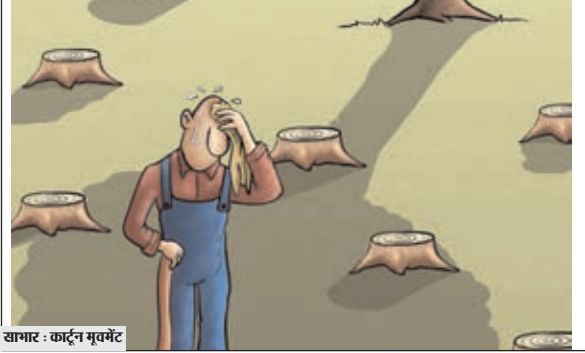
खामर - कार्टून नृत्यक