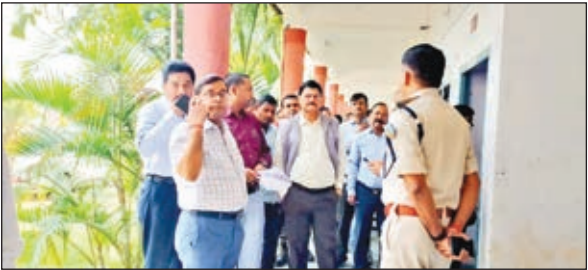
निरीक्षण करते डीसी व एसपी

गढ़वा। जिला निर्वाचन पदाधिकारी सह डीसी शेखर जमुआर एवं एसपी दीपक कुमार पांडेय ने बुधवार को लोकसभा आम चुनाव 2024 के मद्देनजर एसएसजेएस नामधारी कॉलेज गढ़वा में बन रहे पॉलिंग पार्टी डिस्पैच सेंटर का निरीक्षण किया। इस दौरान उक्त पदाधिकारियों ने कॉलेज के विभिन्न कमरों का निरीक्षण कर पॉलिंग पार्टी, सेक्टर मजिस्ट्रेट समेत अन्य के बैठने की व्यवस्था को लेकर आवश्यक निर्देश दिया। वहीं कॉलेज कैम्पस में पॉलिंग पार्टी संग ईवीएम वीवीपैट के डिस्पैच, वाहन की पार्किंग, मतदान के लिए जरूरी आवश्यक सामग्री वितरण