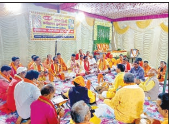
सुंदरकांड पाठ करते लोग

गढ़वा। श्रीकृष्ण गोशाला समिति के तत्वावधान में मंगलवार की संध्या मानस मंडली विशुनपुर इकाई के द्वारा शहर के सोनपुरवा स्थित श्री कृष्ण गोशाला परिसर में संगीतमय सुंदरकांड पाठ का आयोजन किया गया। इस दौरान संख्या 630 बजे से रात्रि नौ बजे तक श्री रामचरितमानस के सुंदरकांड का संगीतमय अखंड पाठ किया गया। इस अवसर पर मानस मंडली विशुनपुर इकाई के द्वारा 481वां संगीतमय सुंदरकांड पाठ किया गया। कार्यक्रम की शुरुआत मानस मंडली और श्रीकृष्ण गोशाला समिति के सदस्यों ने संयुक्त रूप से श्री राम दरवार और श्री राधाकृष्ण दरवार के चित्र पर पुष्प माला अर्पित किया। इस दौरान श्री श्री हनुमानजी की कृपा से सभी समस्यओं का समाधान होता है। आज के समय में सभी मनुष्य को