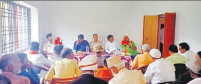
बैठक करते लोग