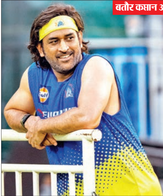
बतौर कप्तान आइपीएल में सबसे ज्यादा जीत

अनुराग ठाकुर ने कहा कि जिस पल इसके लिए बोली शुरू होगी, भारत ओलंपिक की मेजबानी करने के लिए पूरी तरह तैयार रहेगा। उन्होंने कहा, हम दुनिया की तीसरी सबसे बड़ी आर्थिक शक्ति