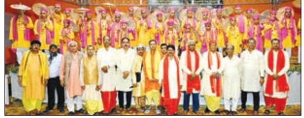
उपनयन के पश्चात् बटुकगण अतिथियों संग ग्रुप फोटो खिंचवाते हुए।

जमशेदपुर। ललित नारायण मिश्र सांस्कृतिक एवं सामाजिक कल्याण समिति द्वारा संप्रति आयोजित मिथिला महोत्सव 2024 सह सामूहिक उपनयन संस्कार के पांचवें दिन बुधवार को उपनयन संस्कार वैदिक विधि विधान से संपन्न हुआ। एग्निको स्थित ट्रान्सपोर्ट मैदान में आयोजित कार्यक्रम का प्रारंभ आम-महु विवाह के विधान के साथ हुआ, तत्पश्चात् मातृका पूजन कर कुल देवी और पितरों का आह्वान किया गया। इसके पश्चात् समस्त बटुक अपने अपने आचार्यों