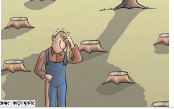
खामर : कार्टून मूवमेंट