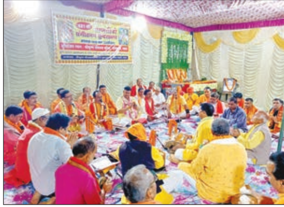
सुंदरकांड पाठ करते लोग