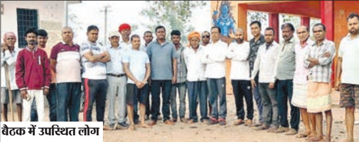
बैठक में उपस्थित लोग