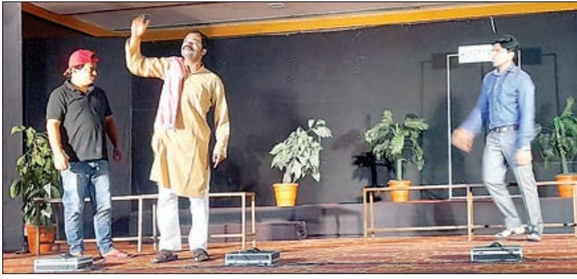
भोजपुर रंगमंच द्वारा आयोजित भोजपुरी नाटक का एक दृश्य।