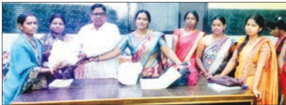
खाद्य सामग्री वितरण के दौरान शामिल लोग