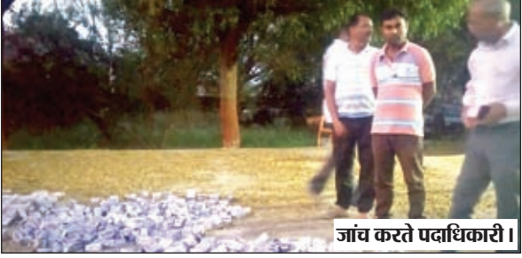
जांच करते पदाधिकारी।

कांडी। झारखंड के स्वास्थ्य मंत्री बन्ना गुप्ता के आदेश पर प्रखंड क्षेत्र में बड़े पैमाने पर सरकारी दवा फेंक दिए जाने के मामले की जांच की गई। उपायुक्त द्वारा गठित जांच कमेटी शनिवार की देर शाम दवाओं की जांच करने के लिए कांडी थाना पहुंची। जहां जप्त दवाओं की विस्तार से जांच की गई। जांच रिपोर्ट उपायुक्त को सौंप दी गई है। जहां से इसे सुबे के स्वास्थ्य मंत्री को भेजा जाएगा। ज्ञात हो कि शनिवार की अहले सुबह मीडिया द्वारा प्राप्त सूचना के आधार पर प्रसिद्ध पर्यटन स्थल सतबहिनी