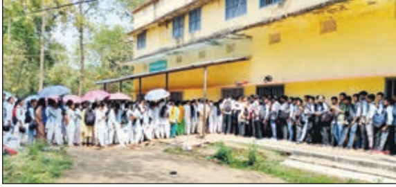
नामांकन के लिए कतार बद्ध खड़े विद्यार्थी

गुमला। शिक्षा जुगाड़ का विषय नहीं है जो पढ़ेगा वही ज्ञान अर्जित करेगा। लेकिन रांची यूनिवर्सिटी का खेल देखिये कि बिना पढ़े ही बच्चों से परीक्षा लिखने की तिथि निर्धारित कर दी गई है। बच्चों को एक माह भी पढ़ने का समय नहीं मिला। चतुर्थ सेमेस्टर का परीक्षा खत्म होते ही 6 मार्च को चतुर्थ सेमेस्टर में साइंस व कामर्स का निकला रिजल्ट निकला जबकि आर्ट्स का 9 मार्च को रिजल्ट प्रकाशित किया जाता है और 11 मार्च को विद्यार्थियों को सेमेस्टर फाइव में नामांकन की अधिसूचना जारी करते हुए फार्म निर्गत कर