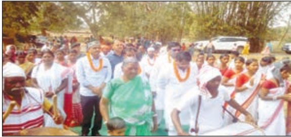
मंवाशीन अतिथि, उद्घाटन करने जाते मंत्री

तो सबसे पहले हमने भूख मिटाने का काम किया, फिर धोती, साड़ी का व्यवस्था किया। हमने खाद्य आपूर्ति विभाग से धोती लुंगी साड़ी का योजना लाया। पिछली सरकार भी चावल देती थी किन्तु दाल नहीं देती थी, किन्तु हमने दाल भी देना शुरू किया। अब मैंने सोचाबिन देने का भी काम किया, अब आपको दाल भात, सब्जी मिलेगा जिससे सभी को अच्छा भोजन मिलेगा, इसके बाद जिनके पास आवास नहीं था उनके लिए अबुवा आवास योजना लाई गई है इससे जिनके घर खपड़ा का है सबका अब पक्का घर होगा। इस तरह इंसान की तीन जरूरत रोटी कपड़ा और मकान का व्यवस्था हमने और हमारे विभाग द्वारा किया गया। मंत्री बनने के बाद हमने नहर निर्माण