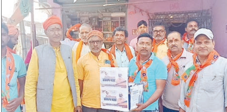
कार्यक्रम में भाजपाई

रहा है कि नहीं उसी को लेकर भारत संकल्प यात्रा सह सुझाव पत्र यात्रा कार्यक्रम किया जा रहा है। भारत संकल्प यात्रा पूरे देश में चलाई जा रही है। इस सुझाव पत्र यात्रा में भाजपा कार्यकर्ताओं के साथ-साथ शहरी एवं ग्रामीण क्षेत्र के माताओं,बहनों बुजुर्गों नौजवानों सहित अन्य लोगों से अपने क्षेत्र में केंद्र सरकार द्वारा की गई विकास कार्यों के बारे में सुझाव पत्र लिया जा रहा है। लोग अपने मंतव्य को लिखकर इस सुझाव पत्र पेटी में डालने का काम कर रहे हैं। उन्होंने कहा कि इसमें या भी लिया जा रहा है कि क्षेत्र में किस तरह का विकास