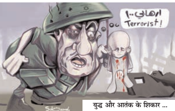
युद्ध और आतंक के शिकार ...