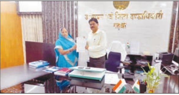
मांग पत्र सौंपती प्रमुख