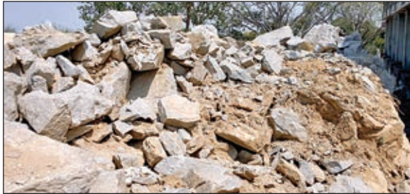
विद्यालय निर्माण स्थल पर तोड़कर रखा गया पत्थर

गुमला। खनन व श्रम कानून का उल्लंघन कर गुमला के सिलाफारी गढ़ में एकलव्य आवासीय विद्यालय का निर्माण किया जा रहा है। केंद्र सरकार की महत्वकांक्षी योजनाओं में शामिल एकलव्य आवासीय विद्यालय है। लगभग 15 करोड़ की लागत से जी प्लस स्कूल व छात्रावास का निर्माण किया जा रहा है। एकलव्य आवासीय विद्यालय की कार्य एजेंसी बुलंद इंप्रूवा कंपनी है। जबकि निर्माण कार्य पेटी पर लेकर ब्रॉज एंड रूप एजेंसी कर रही है। पेटी में किसी कंपनी को काम मिलते ही कार्य की गुणवत्ता पर प्रश्न चिह्न लगना आरंभ हो जाता है। क्योंकि जिस भी एजेंसी को काम दिया जाता है वह सरकार के नियमों के हिसाब से होता है लेकिन जब वह कार्य पेटी काट्टेक्ट को मिल जाता है तो समझ लीजिए की कार्य एजेंसी अपने बचत के लिए गुणवत्ता के साथ दो पांच करना आरंभ कर