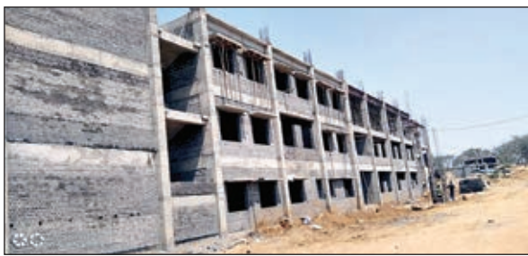
निर्माणाधीन एकलव्य आवासीय विद्यालय