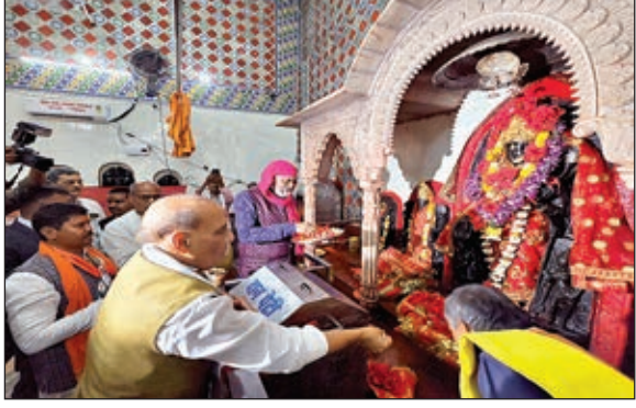
मां भद्रकाली की पूजा अर्चना करते रक्षा मंत्री राजनाथ सिंह व अन्य, मंदिर परिसर में पौधरोपण करते रक्षा मंत्री