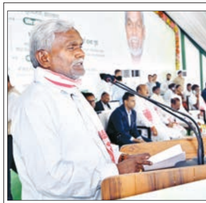
यूरिनियम की खान है, जिससे यहां के बच्चे अपने घर में रहकर माइ भात खाकर भी उच्च शिक्षा ग्रहण कर सकते हैं।

रांची/चाकुलिया। मुख्यमंत्री चंपई सोरेन ने कहा कि उनकी सरकार राज्य में बिजली, पानी, सड़क, शिक्षा सहित अन्य मूलभूत सुविधाओं को सुदृढ़ कर रही है। श्री सोरेन शुक्रवार को चाकुलिया में डिग्री महाविद्यालय के शिलान्यास कार्यक्रम को संबोधित कर रहे थे। उन्होंने कहा कि जब राज्य में बुनियादी व्यवस्थायें मजबूत और सक्रिय होंगी। तभी स्मार्ट गांव बनाने की परिकल्पना पूरी होगी।