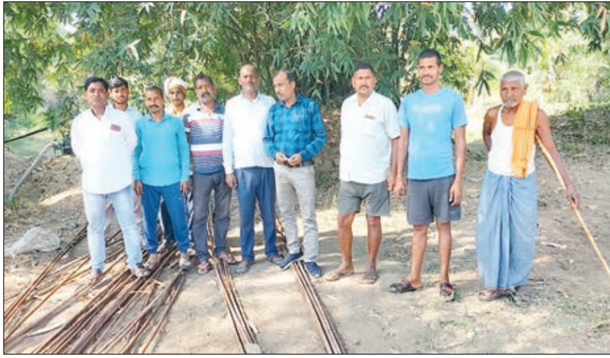
निर्माण कार्य को बंद कराते ग्रामीण

प्रारम्भ में ही पुल निर्माण कार्य में जब अनियमितता बरती जा रही है तो पता नहीं आगे क्या होगा। इसका भविष्य कितना मजबूत होगा यह सोचने की चीज है। ग्रामीणों ने बताया कि आरसीसी से पूर्व पीसीसी होना चाहिए। जबकि यूं ही जेसीबी द्वारा दो बकेट छर्रा डाल कर डेढ़ ट्रेक्टर बालू में 10 बोड़ा सीमेंट का मिश्रण कर मजदूरों द्वारा सूखा मसाला ही डलवा दिया गया है। ग्रामीणों ने कहा कि मेट्रोमेटिक में जंगरोधक सीमेंट का उपयोग किया जा रहा है। ग्रामीणों ने कहा कि पुल का निर्माण बार-बार नहीं होता है। 175 साल बाद चिरप्रतीक्षित मांग के बाद योजना आई है। यह भी डूबंत खाता में चला गया तो फिर सदियों तक लोग नदी में डूबते