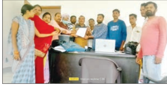
आवेदन देते पंचायत सहायक