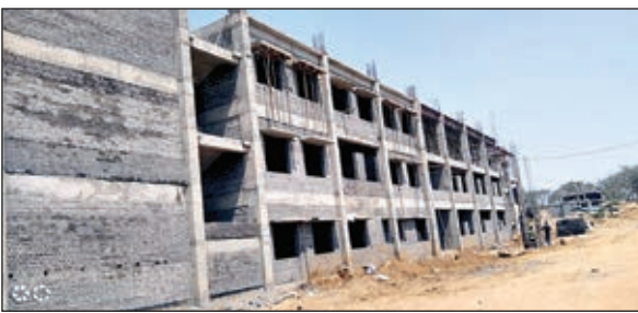
निर्माणाधीन एकलव्य आवासीय विद्यालय