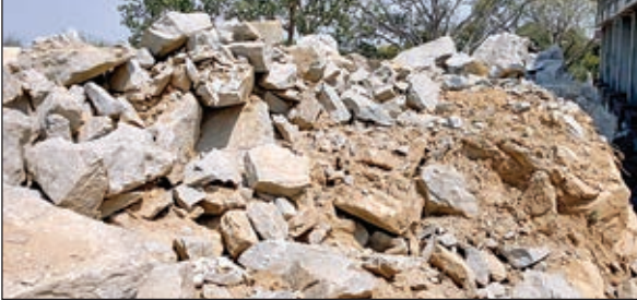
विद्यालय निर्माण स्थल पर तोड़कर रखा गया पत्थर

गुमला। खनन व श्रम कानून का उल्लंघन कर गुमला के सिलाफारी गांव में एकलव्य आवासीय विद्यालय का निर्माण किया जा रहा है। केंद्र सरकार की महत्वकांक्षी योजनाओं में शामिल एकलव्य आवासीय विद्यालय है। लगभग 15 करोड़ की लागत से जी प्लस स्कूल व छात्रावास का निर्माण किया जा रहा है। एकलव्य आवासीय विद्यालय की कार्य एजेंसी बुलंद इंफ्रा कंपनी है। जबकि निर्माण कार्य पेटी पर लेकर ब्रॉज एंड रूप एजेंसी कर रही है। पेटी में किसी कंपनी को काम मिलते ही कार्य की गुणवत्ता पर प्रश्न चिह्न लगना आरंभ हो जाता है। क्योंकि जिस भी एजेंसी को काम दिया जाता है वह सरकार के नियमों के हिसाब से होता है लेकिन जब वह कार्य पेटी काट्टेक्ट को मिल जाता है तो समझ लीजिए की कार्य एजेंसी अपने बचत के लिए गुणवत्ता के साथ दो पांच करना आरंभ कर