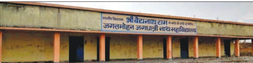
कॉलेज की बिल्डिंग।

70 लाख की लागत से बनी कॉलेज की बिल्डिंग बनी पशुशाला, कोई नहीं देखने वाला