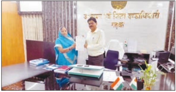
मांग पत्र सौंपती प्रमुख