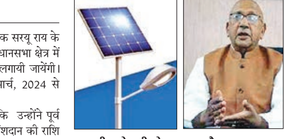
लगायी जानेवाली सोलर लाइट और सरजू राय।

जमशेदपुर। जमशेदपुर पूर्वी के विधायक सरजू राय के निर्देश पर जेडा के माध्यम से पूर्वी विधानसभा क्षेत्र में और 400 अदद सोलर स्ट्रीट लाइटें लगायी जायेंगी। लाइट लगाने का कार्य दिनांक 16 मार्च, 2024 से प्रारंभ हो जायेगा। विधायक सरजू राय ने बताया है कि उन्होंने पूर्व में अपने विधायक निधि से लाभुक अंशदान की राशि का भुगतान कर 2 चरणों में कुल 3063 स्थलों पर सोलर स्ट्रीट लाइट और इएसएल के माध्यम से 2600 स्थानों पर स्ट्रीट लाइट का अधिष्ठान करने का कार्य सम्पन्न किया है। शेष स्थलों एवं पूर्वी विधानसभा क्षेत्र के नागरिकों की मांग पर अतिरिक्त 400 सोलर स्ट्रीट लाइट लगवाने का अनुरोध जेडा से किया था। इसकी स्वीकृति दे दी गयी है और इस संबंध में जेडा की ओर