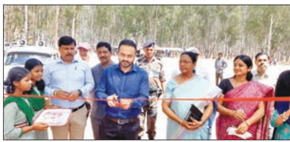
उद्घाटन करते डीसी, विज्ञता को पुरस्कृत करते अतिथि