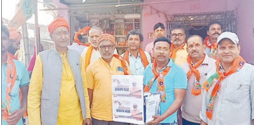
कार्यक्रम में भाजपाई

रहा है कि नहीं उसी को लेकर भारत संकल्प यात्रा सह सुझाव पत्र यात्रा कार्यक्रम किया जा रहा है। भारत संकल्प यात्रा पूरे देश में चलाई जा रही है। इस सुझाव पत्र यात्रा में भाजपा कार्यकर्ताओं के साथ-साथ शहरी एवं ग्रामीण क्षेत्र के माताओं, बहनों बुजुर्गों नौजवानों सहित अन्य लोगों से अपने क्षेत्र में केंद्र सरकार द्वारा की गई विकास कार्यों के बारे में सुझाव पत्र लिया जा रहा है। लोग अपने मंतव्य को लिखकर इस सुझाव पत्र पेटी में डालने का काम कर रहे हैं। उन्होंने कहा कि इसमें या भी लिया जा रहा है कि क्षेत्र में किस तरह का विकास