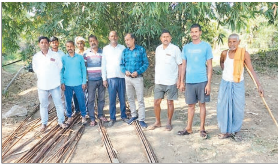
निर्माण कार्य को बंद कराते ग्रामीण

प्रारम्भ में ही पुल निर्माण कार्य में जब अनियमितता बरती जा रही है तो पता नहीं आगे क्या होगा। इसका भविष्य कितना मजबूत होगा यह सोचने की चीज है। ग्रामीणों ने बताया कि आरसीसी से पूर्व पीसीसी होना चाहिए। जबकि यूं ही जेसीबी द्वारा दो बकेट छर्रा डाल कर डेढ़ ट्रेक्टर बालू में 10 बोड़ा सीमेंट का मिश्रण कर मजदूरों द्वारा सूखा मसाला ही डलवा दिया गया है। ग्रामीणों ने कहा कि मेट्रोमेटिक में जंगरोधक सीमेंट का उपयोग किया जा रहा है। ग्रामीणों ने कहा कि पुल का निर्माण बार-बार नहीं होता है। 175 साल बाद चिरप्रतीक्षित मांग के बाद योजना आई है। यह भी डूबंत खाता में चला गया तो फिर सदियों तक लोग नदी में डूबते