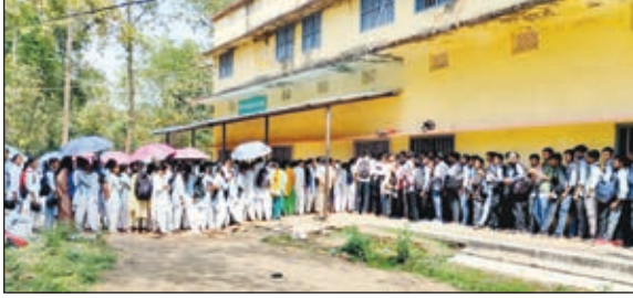
नामांकन के लिए कतार बद्ध खड़े विद्यार्थी

गुमला। शिक्षा जुगाड़ का विषय नहीं है जो पढ़ेगा वही ज्ञान अर्जित करेगा। लेकिन रांची यूनिवर्सिटी का खेल देखिये कि बिना पढ़े ही बच्चों से परीक्षा लिखने की तिथि निर्धारित कर दी गई है। बच्चों को एक माह भी पढ़ने का समय नहीं मिला। चतुर्थ सेमेस्टर का परीक्षा खत्म होते ही 6 मार्च को चतुर्थ सेमेस्टर में साइंस व कामर्स का निकला रिजल्ट निकला जबकि आर्ट्स का 9 मार्च को रिजल्ट प्रकाशित किया जाता है और 11 मार्च को विद्यार्थियों को सेमेस्टर फाइव में नामांकन की अधिसूचना जारी करते हुए फार्म निर्गत कर