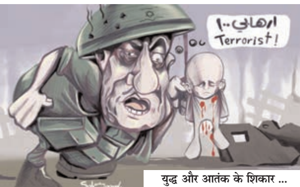
युद्ध और आतंक के शिकार ...