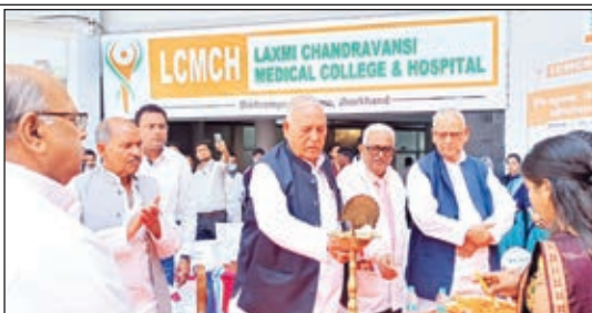
विश्रामपुर लक्ष्मी चंद्रवंशी मेडिकल कॉलेज एंड हॉस्पिटल में लगे आई कैम्प दीप प्रज्वलित कर उद्घाटन करते अतिथि व कैम्प में शामिल लोग।

यहां सभी तरह के शैक्षणिक संस्थान हैं। मेडिकल कॉलेज में देश की अव्वल सेवा दिया जा रहा है। राज्य के लोकप्रिय चिकित्सकों के द्वारा नेत्र जांच व आपरेशन किया जा रहा है। जहां 100 रोगियों का आपरेशन फेंको पद्धति से किया गया।