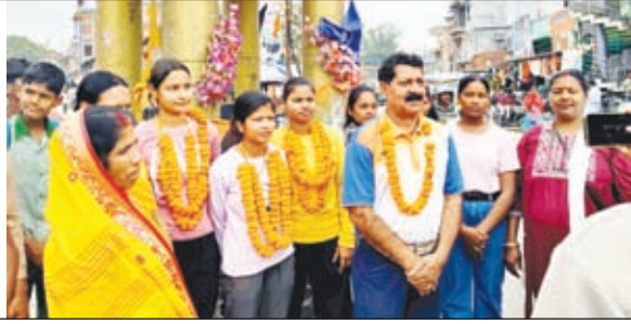
स्थानीय टावर चौक में खिलाड़ियों को रवाना करने जुटे लोग