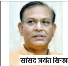
सांसद जयंत सिन्हा।

जयंत सिन्हा के प्रयासों से कैटोनमेंट बोर्ड के नगर निकाय में विलय को मिली मंजूरी मिल गई है। भाजपा रामगढ़ के कार्यकर्ताओं ने बताया कि सांसद सह अध्यक्ष वित्त समन्वयी संसदीय स्थायी समिति जयंत सिन्हा रामगढ़ छावनी क्षेत्र के नगर निकाय में विलय को लेकर काफी वर्षों से प्रयासरत थे। उन्होंने रक्षा मंत्री राजनाथ सिंह को इस संबंध में 2021 में पत्र लिखकर व मुलाकात कर भी इस सम्बन्ध में अधिसूचना जारी करवाने के लिए आग्रह किया था। कैटोनमेंट बोर्ड रामगढ़ का झारखण्ड सरकार के अधीन नगर निकाय में विलय करने की