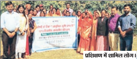
प्रशिक्षण में शामिल लोग।

हजारीबाग। पकरी बरवाडीह कोयला खनन परियोजना में ग्रामीणों के लिए आधुनिक कृषि खेती और तकनीक पर तीनदिवसीय आवासीय प्रशिक्षण कार्यक्रम शुरू किया। यह परिवर्तनकारी पहल आधुनिक कृषि खेती और तकनीकों पर केंद्रित थी और हजारीबाग में होली क्रॉस कृषि विज्ञान ट्रस्ट में आयोजित की गई थी। यह आवश्यक कार्यक्रम 13 मार्च, 2024 को समाप्त होगा। नवीनतम कृषि पद्धतियों के साथ ग्रामीणों को सशक्त बनाने के उद्देश्य से, कार्यक्रम ने टिकाऊ कृषि को बढ़ावा देने और ग्रामीण समुदायों की आजीविका में सुधार के लिए एनटीपीसी के समर्पण को रेखांकित किया। प्रशिक्षण कार्यक्रम