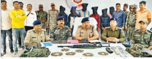
प्रेस कॉन्फ्रेंस करते सरगुजा पुलिस महानिरीक्षक एवं एसपी आदि।