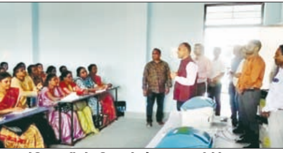
पोलिंग पार्टी को प्रशिक्षण के दौरान जानकारी देते उपायुक्त