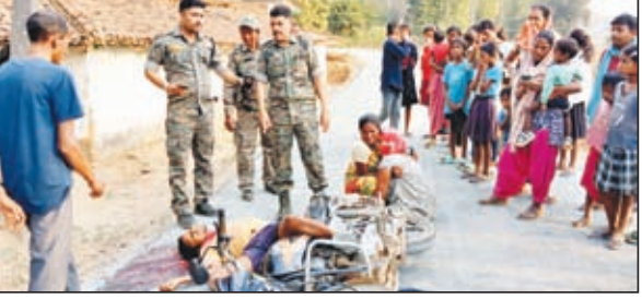
हत्या के बाद पहुंची पुलिस,रोंते विलखते परिजन