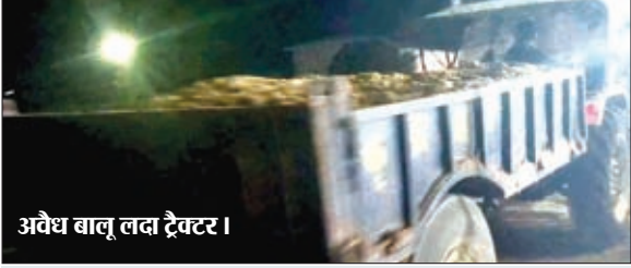
अवैध बालू लदा ट्रैक्टर।

कांडी। अवैध बालू का काला कारोबार कांडी प्रखंड में घड़ल्ले से जारी है। बालू खनन पर सरकार के रोक के बावजूद कांडी प्रखंड में अवैध बालू खनन व परिवहन जारी रहने से सरकार को करोड़ों रुपए राजस्व का नुकसान हो रहा है। रात होते ही कोयल नदी में आधा दर्जन से अधिक जगहों पर अवैध खनन शुरू हो जाता है और बालू माफिया बेखौफ होकर ट्रैक्टरों से बालू का परिवहन व बिक्री करते नजर आते हैं। कोयल नदी के खरौंधा, जयनगर, कोरगाई, मोखापी, राणाडीह व सोहगाड़ा थंडरिया के बीच सहित अन्य स्थानों से बालू माफियाओं द्वारा बेखौफ व बेधड़क होकर रात