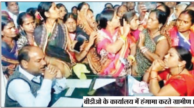
बीडीओ के कार्यालय में हंगामा करते ग्रामीण।