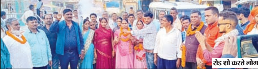
रोड शो करते लोग।