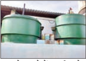
बचत के मामले में वास्तविक गेम चेंजर होगा।

इसके साथ ही होटल फॉड एन बिजॉइड स्मार्ट होटल और होटल मैनासी बिस्दुपुर बायो गैस वेस्ट मैनेजमेंट प्रणाली प्राप्त करने वाले झारखंड के पहले होटल बन जायेगे। इसका मुख्य उद्देश्य जैव-निम्नीकरण कचरे को उत्पादन के समय ही संभाल कर देना है। यह 150 वर्ग फुट के देश में परिवहन, उत्सर्जन, गैस उत्पादकता पर बचत करके अरबों डॉलर की