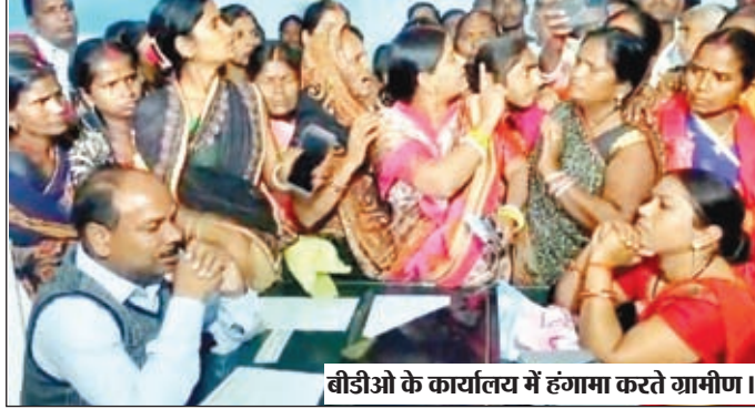
बीडीओ के कार्यालय में हंगामा करते ग्रामीण।