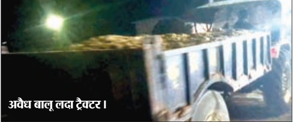
अवैध बालू लदा ट्रैक्टर।

कांडी। अवैध बालू का काला कारोबार कांडी प्रखंड में घड़ल्ले से जारी है। बालू खनन पर सरकार के रोक के बावजूद कांडी प्रखंड में अवैध बालू खनन व परिवहन जारी रहने से सरकार को करोड़ों रुपए राजस्व का नुकसान हो रहा है। रात होते ही कोयल नदी में आधा दर्जन से अधिक जगहों पर अवैध खनन शुरू हो जाता है और बालू माफिया बेखौफ होकर ट्रैक्टरों से बालू का परिवहन व बिक्री करते नजर आते हैं। कोयल नदी के खरौंधा, जयनगर, कोरगाई, मोखापी, राणाडीह व सोहगाड़ा थंडरिया के बीच सहित अन्य स्थानों से बालू माफियाओं द्वारा बेखौफ व बेधड़क होकर रात