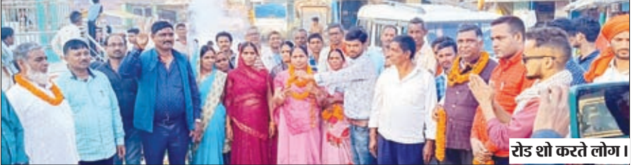
रोड शो करते लोग।