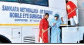
चलंत आई हॉस्पिटल में ऑपरेशन के बाद उतरती एक रोगी।

■ टाटा स्टील फाउंडेशन ने पूरे झारखंड में किया 100 मोतियाबिंद सर्जिकल शिविरों का आयोजन